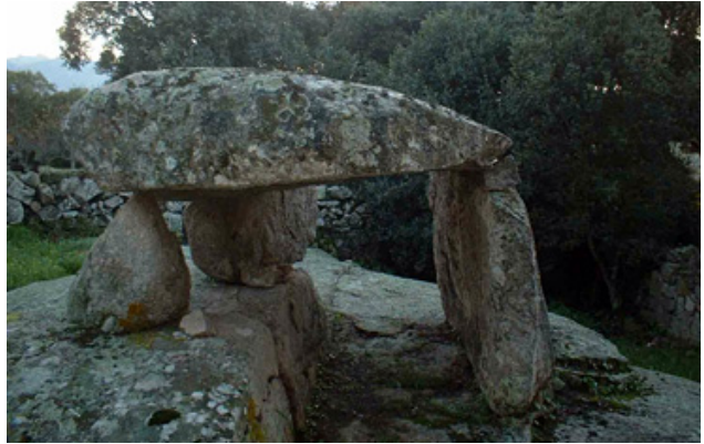
Figg. 3, 4 - Dolmen di Ladas e di Bilella in territorio di Luras-SS (da http://www.sardegna.digitallibrary.it/mmt/480/100931.jpg e http://www.sardegna.cultura.it/immagini/7_112_20090430125045.jpg ).