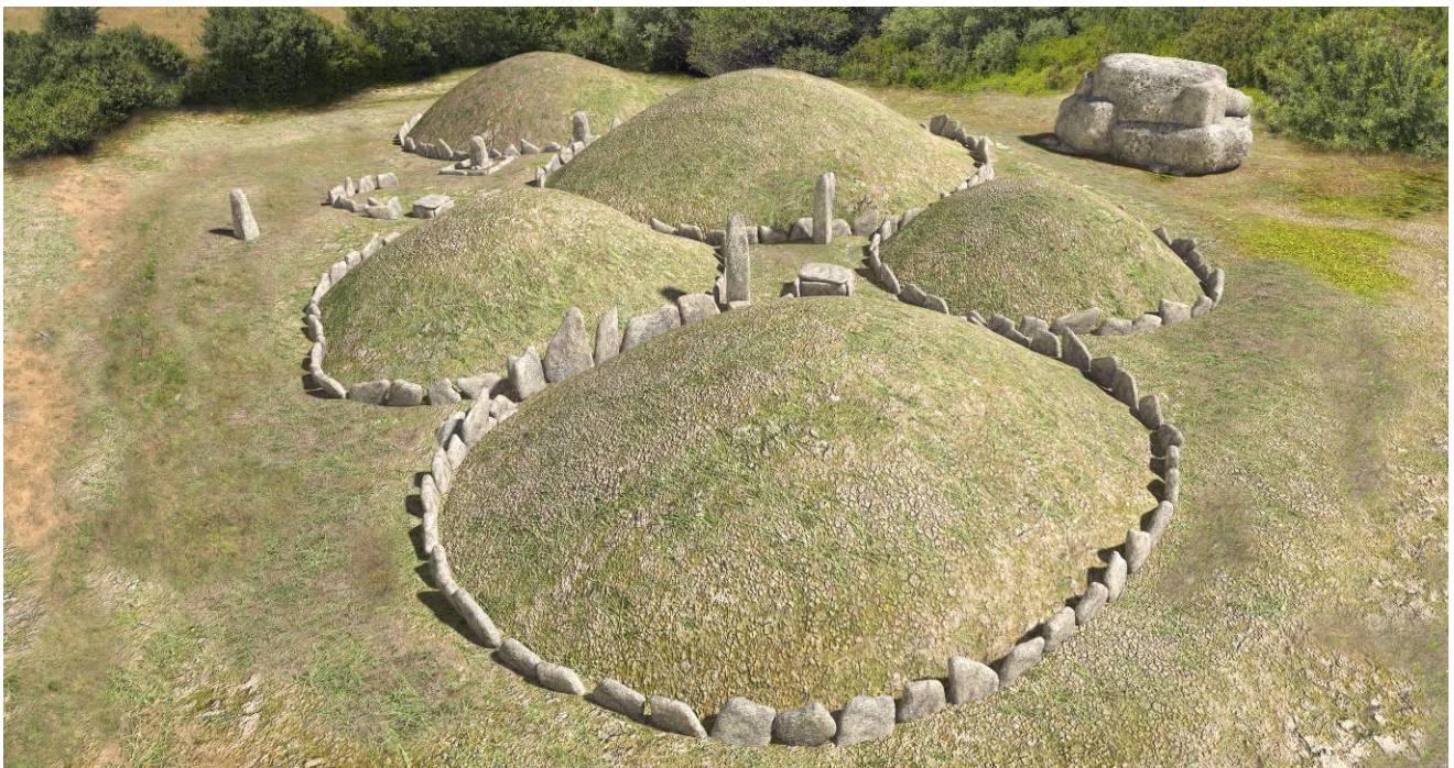
Fig. 1 - Render dei circoli funerari.

La necropoli neolitica di Li Muri (Arzachena, SS) è composta da una serie di ciste dolmeniche, anticamente colmate da un tumulo di cui oggi residua solo la piattaforma di pietre incluse all'interno di uno o più anelli di lastre di pietra infisse a coltello, fino a formare una collinetta artificiale di forma pressappoco circolare (fig. 1).