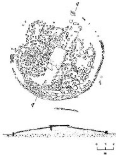
Fig. 2 - Tomba a cista con tumulo circolare di La Macciunitta di Arzachena (da ANTONA, LO SCHIAVO, PERRA fig. 2 p. 243).