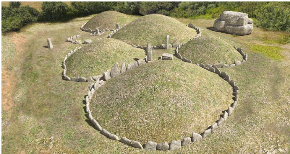
Fig. 1 - Render dei circoli funerari.

Nel territorio di Arzachena lo ritroviamo ad esempio nelle tombe a circolo di Li Muri (fig. 1) e di La Macciunitta (fig. 2), nella diffusa consuetudine di sigillare, con un accumulo di pietrame, le sepolture in tafoni ed anfratti caratteristici del granito, nelle tombe megalitiche, dalle allées couvertes alle tombe di giganti di Moru (fig. 3), Coddu Vecchju e di Li Lolghi.