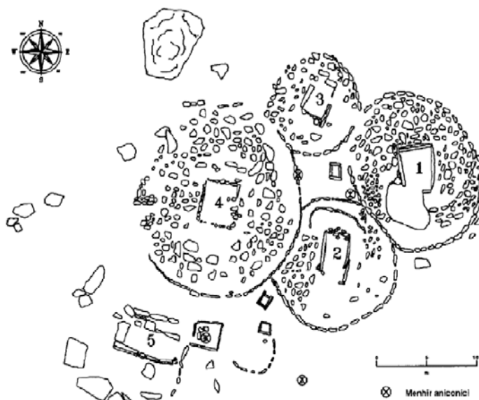
Fig. 1 Necropoli di Li Muri (Arzachena, SS). Planimetria.

Nel IV - V millennio a.C., parallelamente all'uso di seppellire in fossa, si diffonde lungo l'arco continentale della Catalogna, Linguadoca, Provenza e nell'asse insulare Corsica-Sardegna, la sepoltura in cista litica. Quest'aspetto del megalitismo funerario documentato nella necropoli di Li Muri (fig. 1), collocato cronologicamente nel Neolitico recente sardo (3400-3200 a.C.), è definito "protomegalitismo".