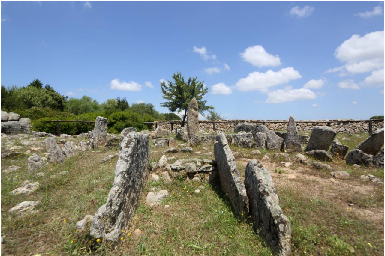
Fig. 2 - Arzachena, Necropoli di Li Muri, cista litica del circolo 2.

Non si conosce il tipo di copertura delle ciste funerarie di Li Muri, trovate sempre prive dell'eventuale lastrone superiore. La stessa situazione è stata riscontrata in analoghi monumenti della Corsica meridionale assimilabili a quelli galluresi, fatto che ha indotto alcuni ad ipotizzare l'originale esistenza di una copertura lignea.