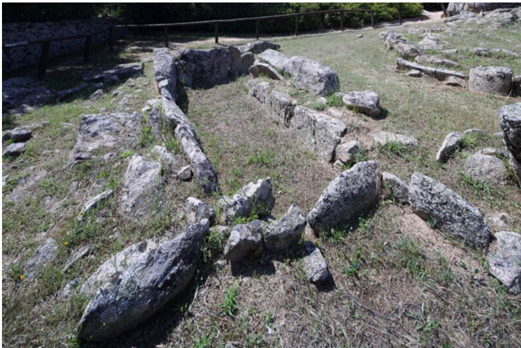
Figg. 2, 3 - Arzachena, Necropoli di Li Muri, tomba 5.