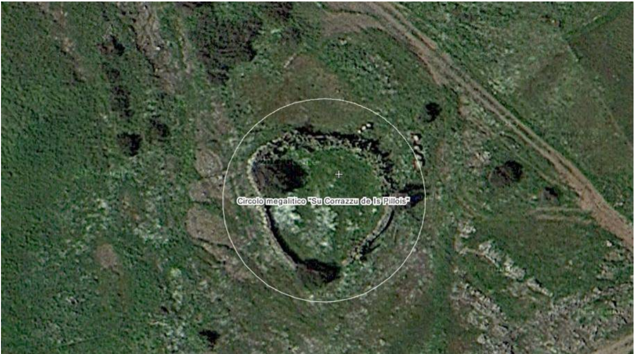
Fig. 3 - Circolo megalitico Su Corrazzu de Is Pillois di Guspini

I confronti più immediati per l'architettura funeraria gallurese sono da ricercarsi negli analoghi monumenti della Corsica 4 (fig. 4), interessata anch'essa nel medesimo lasso di tempo, come del resto la Catalogna, la Linguadoca e la Provenza, dal nascente fenomeno del megalitismo 5 .