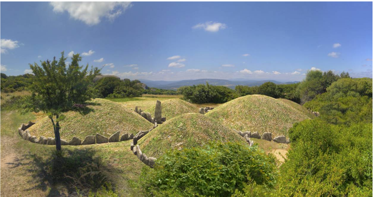
Fig. 1 - Render dei circoli funerari.

Il circolo megalitico è un tipo di sepoltura, in uso nella regione storica della Gallura, formata da una serie di cerchi concentrici di pietre, idonee a reggere un tumulo di terra di copertura, al centro dei quali è sistemata una cista litica con funzione di vano sepolcrale (fig. 1).