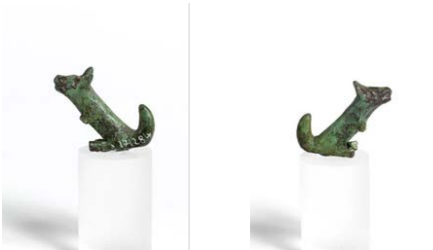
Figg. 2, 3 - Su Nuraxi, figurina in bronzo di cane.

appena accennati, e il muso segnato da una linea incisa in corrispondenza della bocca. Si data tra il X e il VII secolo a.C. (figg. 2, 3, 4, 5).