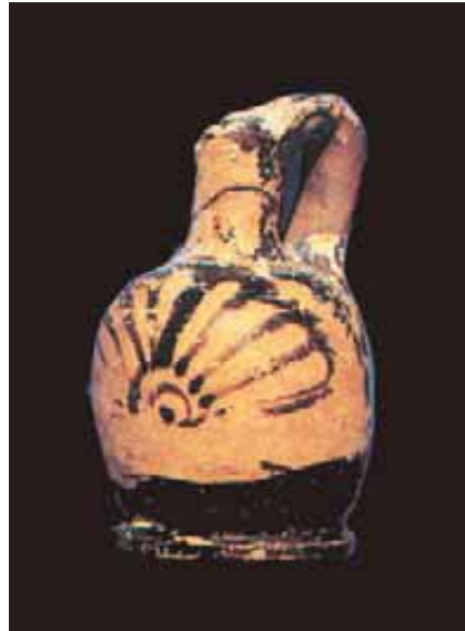
Fig. 3 - Lekythos aribalica a figure rosse, capanna oo, Su Nuraxi (da Lilliu, Zucca 1988, fig. 35, p. 62).