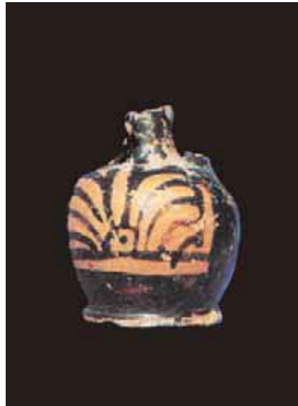
Fig. 2 - Lekythos aribalica a figure rosse, capanna vv, Su Nuraxi (da Lilliu, Zucca 1988, fig. 34, p. 62).

Attribuibili alla Fase Punica-Romana (V sec. a.C. – III sec. d.C.) vi sono due lekythoi 1 ariballiche di fabbrica attica a figure rosse (V secolo a.C.), decorate nella parte frontale del corpo con una palmetta a nove foglie (figg. 2, 3).