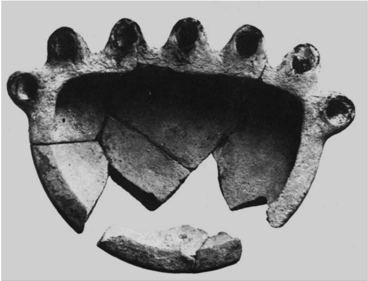
Fig. 2 - Silo della torre C: lampada a sette becchi del tipo "hanouka", datata alla fine IV sec. a.C. (da Lilliu, Zucca 1988, fig. 36, pag. 63).

Sulla base della tipologia dei reperti rinvenuti 1 è stata avanzata la proposta di interpretare il deposito come lo scarico di una parte della stipe votiva di un sacello, funzionante almeno dal IV al II/inizio I secolo a.C., secondo una prassi di riutilizzo ampiamente attestata nella Sardegna punica.