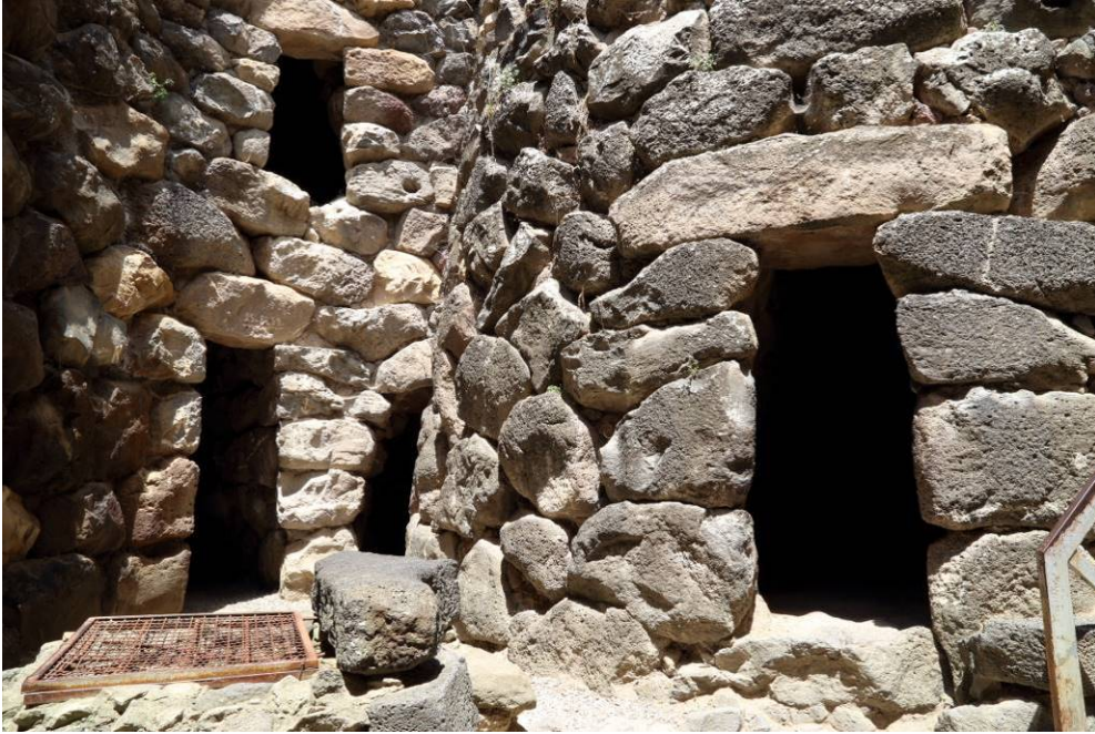
Fig. 2 - Particolare del cortile in cui si vede al centro l'ingresso alla camera della torre E.