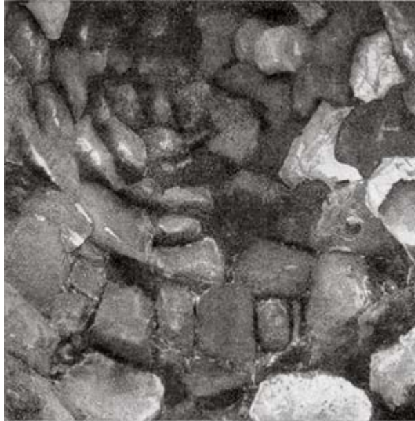
Fig. 4 - Camera della torre E (da Lilliu 1962, Tavola LXV.1, p. 337).

(diametro interno m. 1,11/2,30; profondità m. 2,15), con pavimento interno e bocca realizzati con grossolane pietre laviche disposte a filari, ascrivibile alla Fase C, nel cui fondo, in cui si trova un incavo per raccogliere la falda acquifera, è stato recuperato il manico in bronzo di un secchio nuragico.