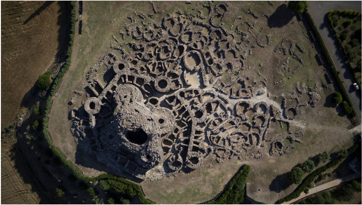
Fig. 2 - Foto aerea dell'area archeologica.

La torre perimetrale (fig. 3), accessibile da cortile attraverso un ingresso architravato e un corridoio lungo 3,88/2,90 m. e largo 1,00/1,99 m., in origine era formata da due camere sovrapposte. Presenta diametro basale ed altezza di volta di 4,00 x 7,73 m. Non conserva completa la volta a tholos .