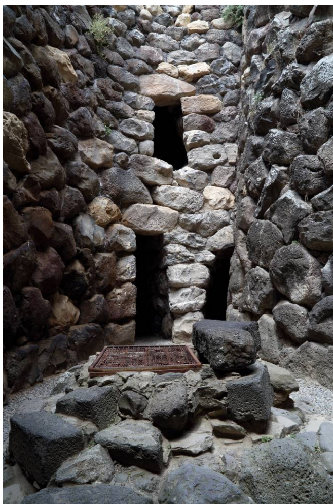
Fig. 3 - Particolare del cortile in cui si vede al centro l'ingresso alla camera della torre D (foto di Unicity S.p.A.).

Il doppio ordine di feritoie (nove al livello inferiore, otto a quello superiore) ricavate nella parete della camera inferiore, risultano perfettamente apprezzabili in quanto non furono obliterate all'interno, ma solamente all'esterno. Nello spazio compreso tra gli accessi alle torri D ed E, a m. 3,65 da terra, si apre la porta trapezoidale (m. 1,67 di altezza) di ingresso ad una cameretta a tholos (m. 4,23 di diametro per 5,20 m. di altezza), munita di nicchione e stipetto a muro, raggiungibile direttamente dal cortile con una scala mobile.