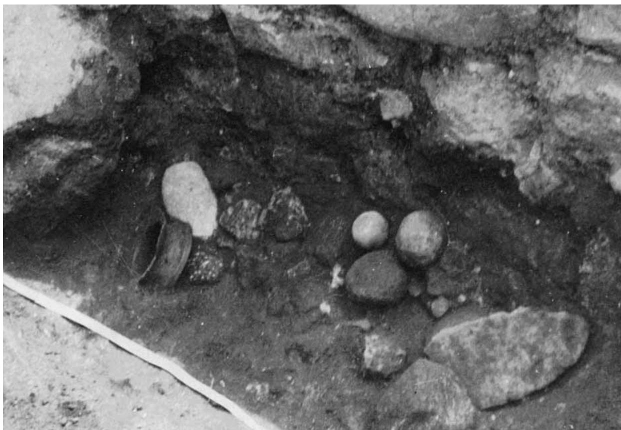
Fig. 4 - Barumini, Su Nuraxi. Vano 135: ceramiche, macinelli e pestelli (da Lilliu, Zucca 1988, fig. 21, p. 44).