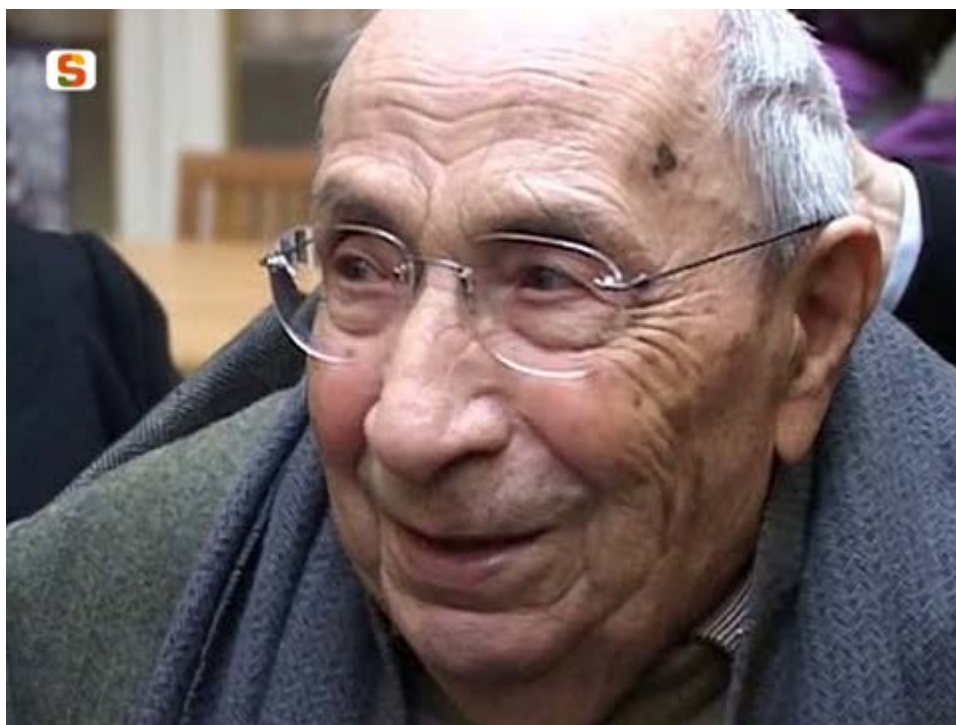
Fig. 1 - Giovanni Lilliu.

Giovanni Lilliu, " professori de is perdas beccias ", così lui si definiva, è stato un archeologo di fama internazionale e un grande intellettuale, che con la sua intensa attività intellettuale e i suoi numerosi ed importanti contributi ha dato lustro non solo alla scienza archeologica, ma anche alla storia, alla cultura, alla vita politica e istituzionale sarda (fig. 1).