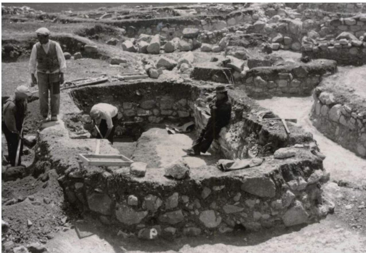
Fig. 2 - Giovanni Lilliu dirige lo scavo della capanna 135 del villaggio di Su Nuraxi di Barumini.

Nel 1955 ha fondato e diretto per venti anni la Scuola di Specializzazione di Studi Sardi dell'Università di Cagliari, ricoprendo anche il ruolo di Professore ordinario di Antichità sarde, ed è stato anche Preside della Facoltà di Lettere e Filosofia.