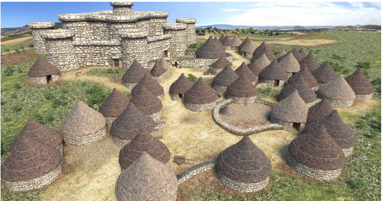
Fig. 1 - Render di Su Nuraxi di Barumini.

Compaiono in piccole quantità frammenti di molluschi marini, frutto di un consumo occasionale ma che comunque testimonia i contatti con la costa.