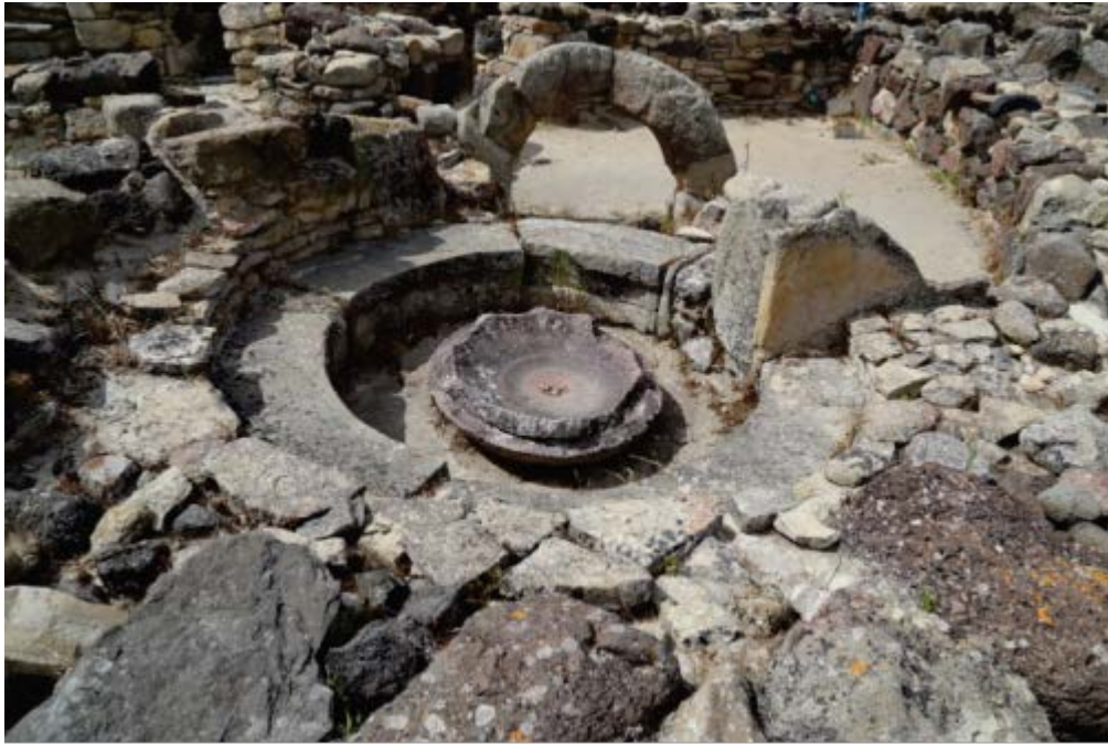
Fig. 2 - Su Nuraxi, casa a corte 20, vano 65 con sedile e bacile centrale.

Gli edifici, interpretabili come spazi rituali all'interno delle abitazioni, sono di pianta circolare, con sedile perimetrale in pietra. Al centro del vano era collocato un bacile litico con piede modanato, poggiante su un pavimento lastricato, e inclinato in direzione di uno o più fori aperti alla base dei sedili, per il deflusso dei liquidi (fig. 3).