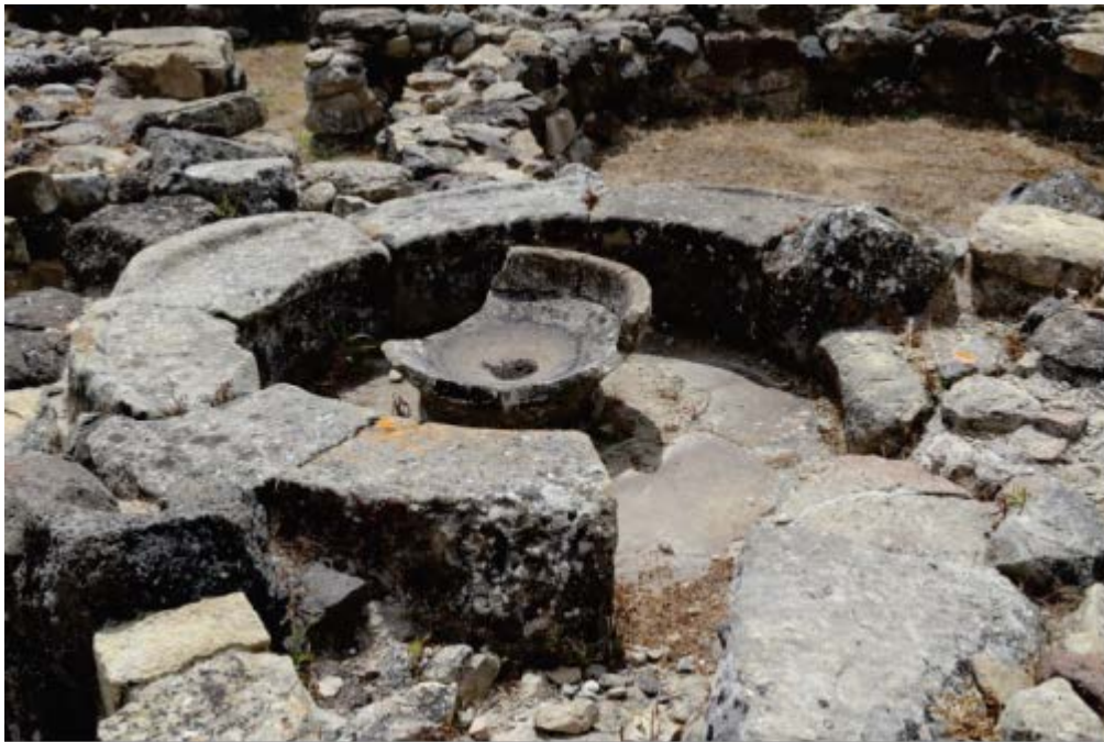
Fig. 1 - Area archeologica di Su Nuraxi, casa a corte 42, vano 90 con sedile e bacile centrale.

All'interno di un complesso di ambienti disposti ad insula 1 del villaggio nuragico di Su Nuraxi (capanne 51, 64, 65, 90, 175, 195, τ, e ππ), sono stati messi in luce otto piccoli vani circolari 2 , riconducibili al tipo denominato in letteratura archeologica come "rotonde con bacile" (figg. 1, 2).