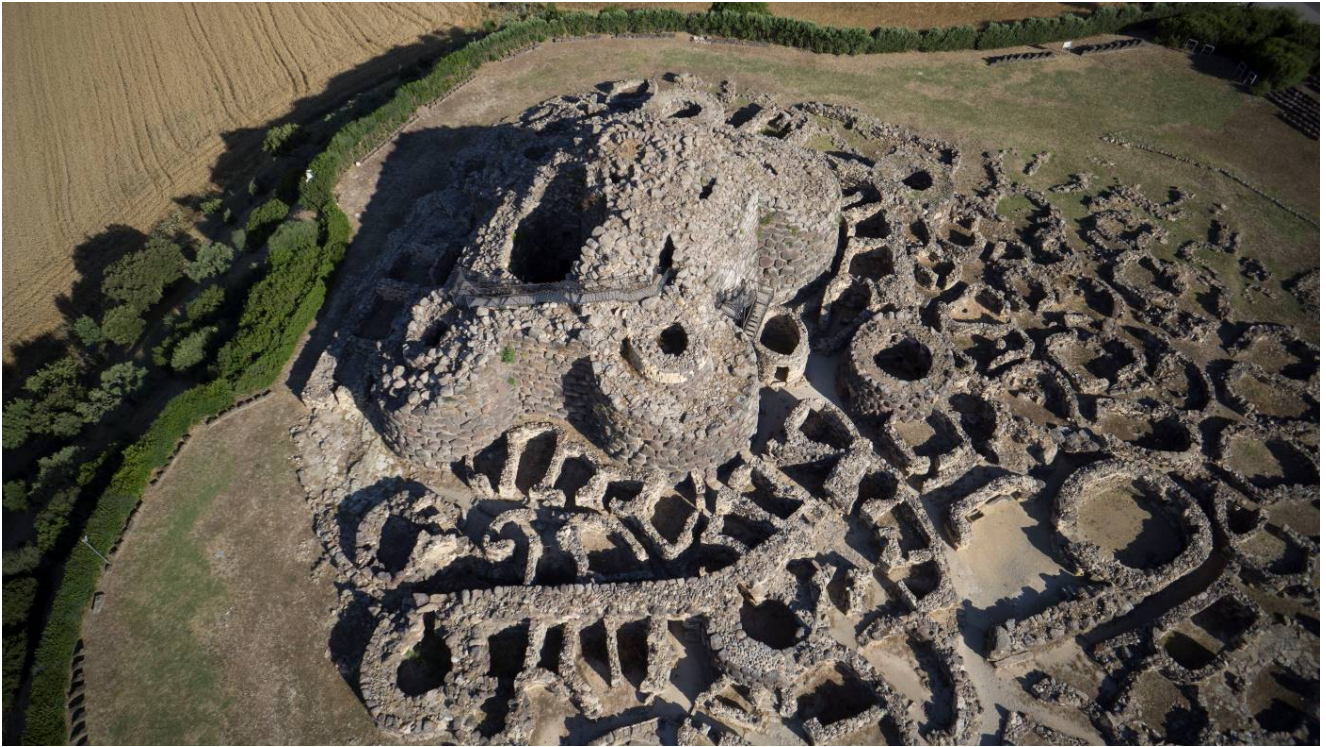
Fig. 9 - Foto aerea dell'area archeologica.

Su Nuraxi rappresenta oggi il monumento nuragico più conosciuto al mondo, grazie anche all'iscrizione nel 1997 nella lista del Patrimonio Mondiale dell'Unesco (fig. 9).