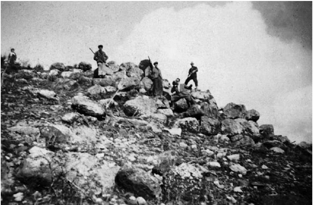
Fig. 2 - Anno 1937, Su Nuraxi prima dello scavo. A destra affiora la torre C del bastione, a sinistra il cortile (da Lilliu, Zucca 1988, fig. 8, p. 28).

L'esplorazione del complesso nuragico di Su Nuraxi di Barumini iniziò nell'estate del 1940, con un saggio realizzato alla base della collinetta artificiale, limitato all'apertura di una sola trincea presso la torre meridionale del bastione 5 . La camera di quest'ultima, con sei filari in vista, era nota come "Sa Funtana" (il pozzo), e già in passato era stata in parte liberata dal crollo durante scavi clandestini finalizzati, si dice, alla ricerca del tesoro. Nel 1949 furono eseguiti a spese del proprietario del terreno, alcuni saggi preliminari 6 . Lo scavo, portato a livello sui lati SE-NE del bastione, si arrestò all'altezza della porta-finestra sopraelevata del nuraghe. Fu scoperto un tratto di antemurale a Sud-Est. Il cortile fu svuotato dal crollo sino al livello raggiunto all'esterno e si evidenziò l'andito tra il cortile e la portafinestra, ritrovato colmo di scheletri umani riferibili ad Età Storica. Fu messa in luce