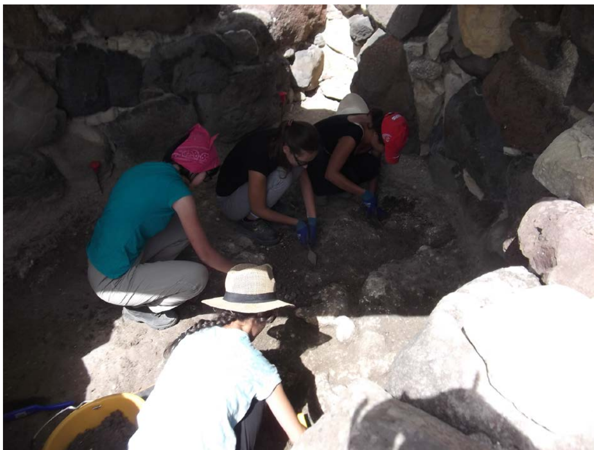
Fig. 8 - La ripresa delle indagini nel sito a cura dell'Università di Cagliari.

Tra le numerose pubblicazioni di taglio scientifico e divulgativo succedutesi in questi ultimi cinquant'anni inerenti l'area archeologica di Su Nuraxi 10 , vi è una guida curata da