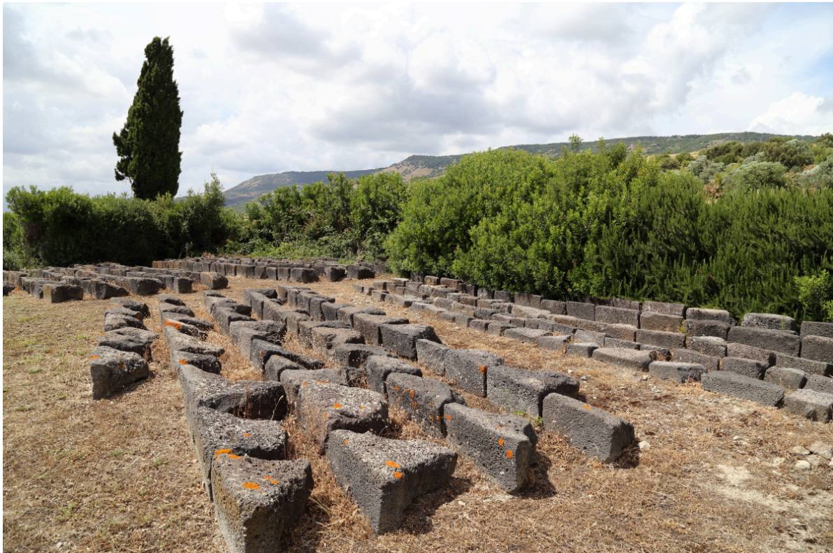
Fig. 7 - I conci a T.

in corrispondenza del terrazzo, a i mensoloni sporgenti in marna. Mastio, cortine e torri erano coronati da mensole che sostenevano ballatoi-piombatoi. Questi ultimi, oggi crollati dalla posizione originaria, si trovano attualmente esposti lungo la recinzione dell'area archeologica (figg. 7, 8).