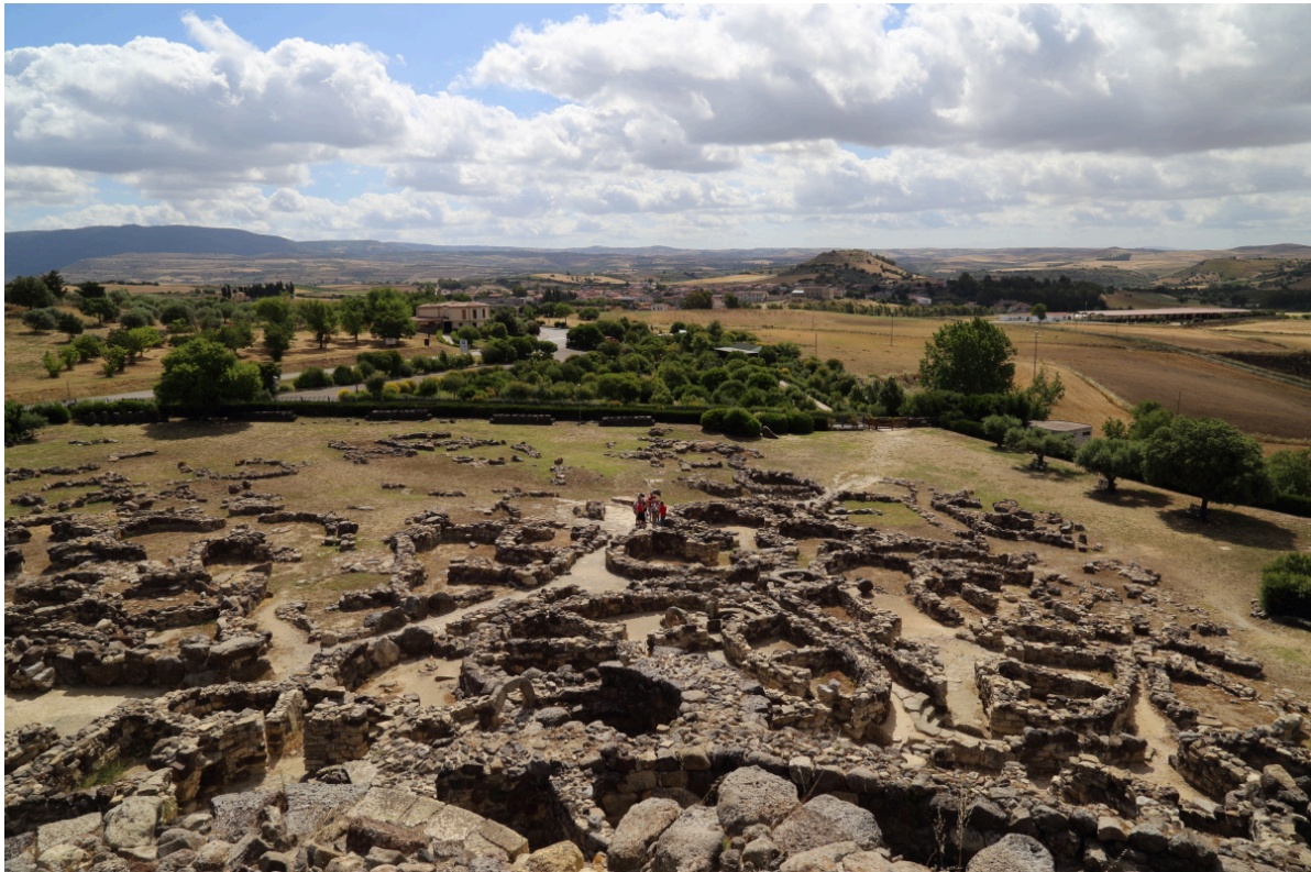
Fig. 9 - Il villaggio.

forma circolare, costituite da un unico ambiente e con copertura lignea di forma conica (fig. 9).