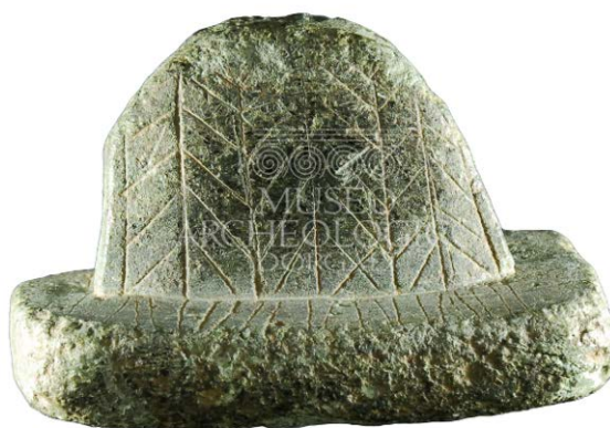
Fig. 1 - Lisciatoio

Un lisciatoio in steatite è stato rinvenuto negli Anni Trenta del secolo scorso da Antonio Taramelli nel piccolo villaggio nuragico di Isportana, le cui rovine si trovano nella periferia Sud-Est dell'abitato di Dorgali, unitamente a frammenti ceramici, pesi da telaio e vaghi di collana in pasta vitrea.