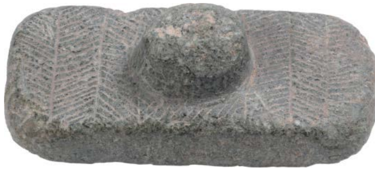
Fig. 3 - Lisciatoi dal nuraghe Santu Antine di Torralba (da CASTIA 2014, p. 270).

La categoria dei lisciatoi si annovera tra gli oggetti d'uso comune presumibilmente utilizzati nella lavorazione della ceramica e delle pelli; spesso sono decorati da motivi incisi a "spina di pesce" (fig. 3) e forniti di presa, in genere semplice, talvolta modellata a forma di modellino di nuraghe (fig. 4).