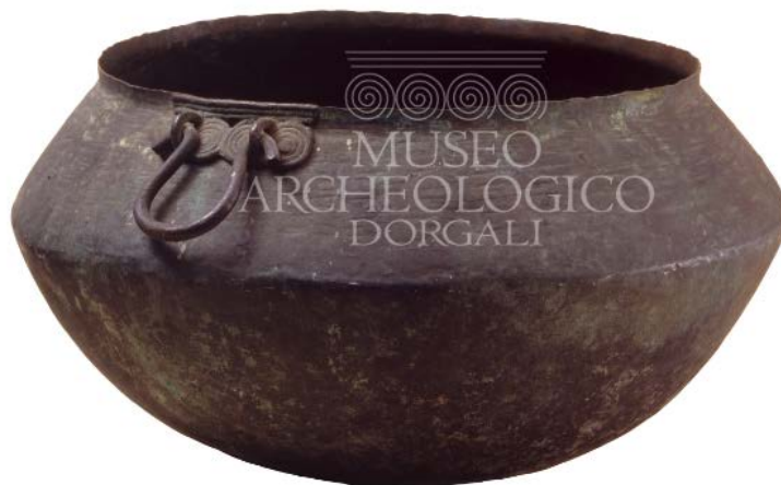
Fig. 1 - Calderone bronzeo da Cala Gonone-Dorgali (da http://www.museoarcheologicodorgali.it/wp/museo_archeologia_in_sardegna/la-storia-di-dorgali-in-20-reperti/ ).

L'attacco delle anse è formato da una placca con quattro spirali affiancate, sormontate da un motivo a costolature orizzontali, munita di piccola maniglia (figg. 1, 2).