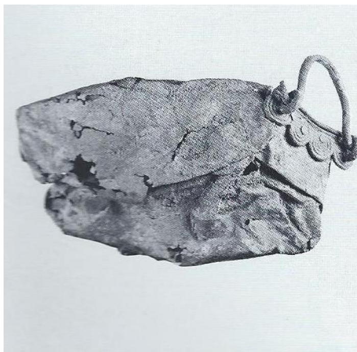
Fig. 3 - Calderone accartocciato dal ripostiglio di San Francesco di Bologna (da LO SCHIAVO 1990, p. 250, fig. 235).

L'esemplare trova un confronto in un altro calderone simile di fattura sarda, rinvenuto completamente accartocciato come scarto metallico nel ripostiglio di San Francesco di Bologna, oggi esposto al Civico Museo archeologico di Bologna, che presenta identico attacco dell'ansa a quadrupliche spirale (fig. 3).