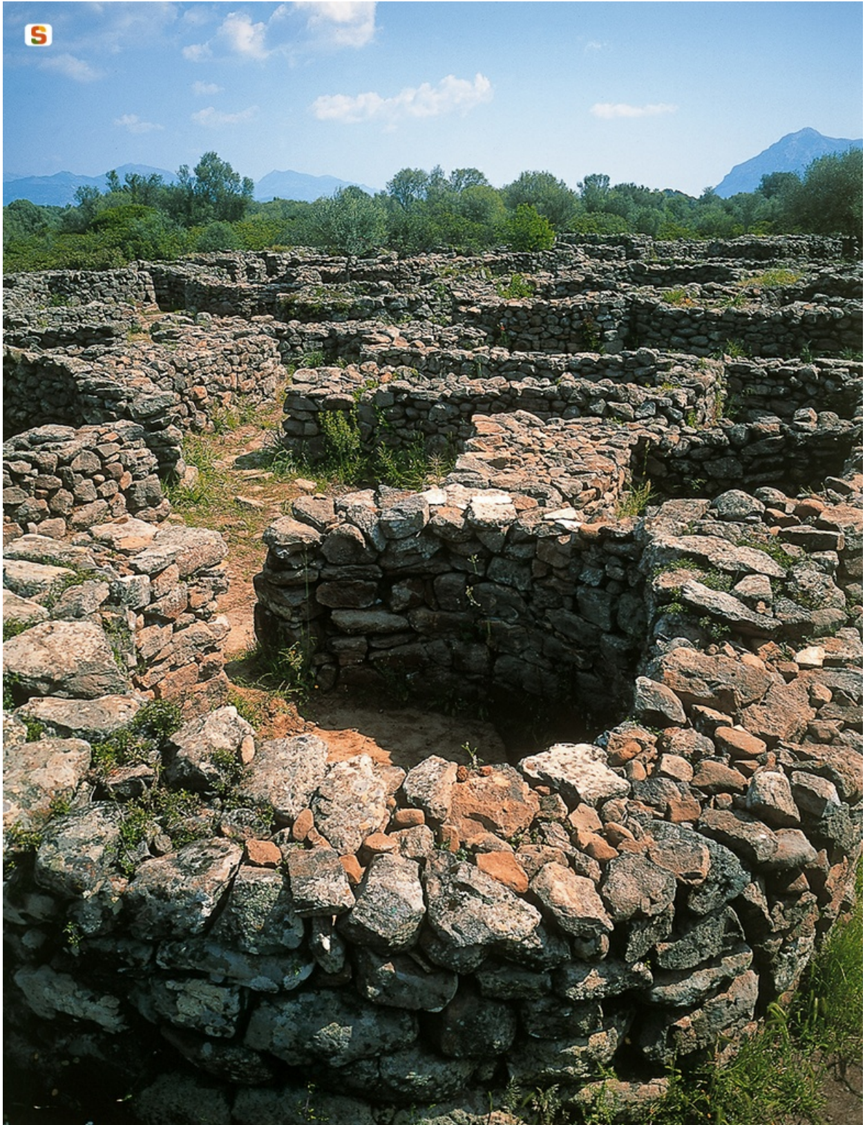
Fig. 2 - Particolare delle capanne del villaggio di Serra Orrios-Dorgali (da http://www.sardegnaigitallibrary.it/index.php?xsl=615&s=17&v=9&c=4461&id=63111 ).