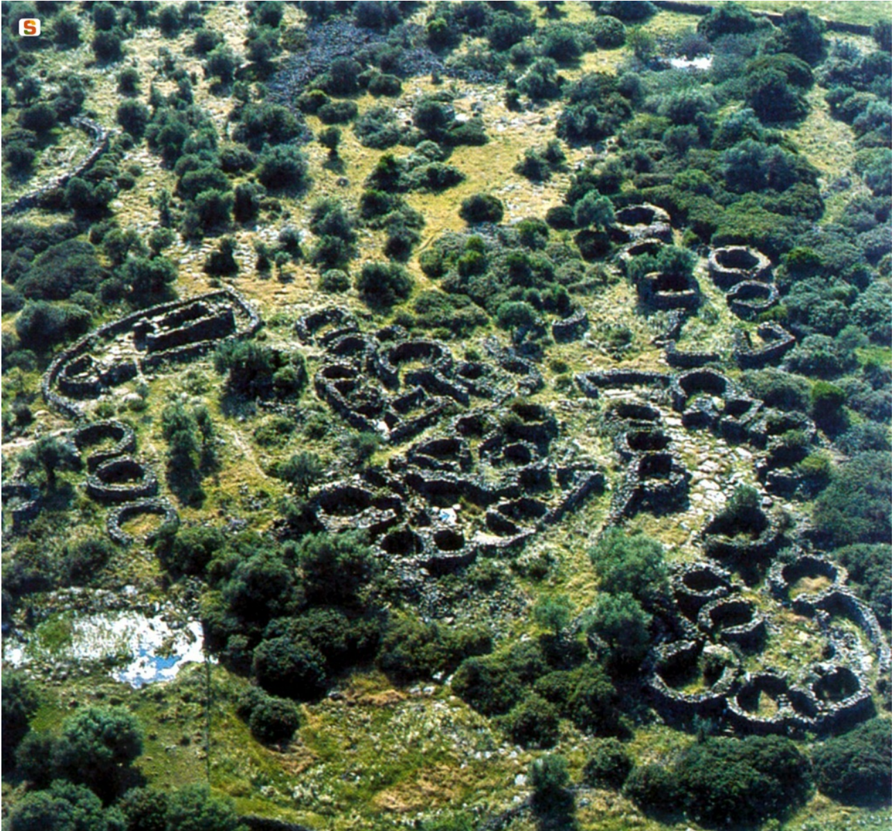
Fig. 1 - Veduta aerea del villaggio nuragico di Serra Orrios-Dorgali.

Dal villaggio nuragico di Serra Orrios, in territorio di Dorgali (figg. 1, 2) proviene una doppia ascia (fig. 3), un attrezzo in lega di bronzo utilizzato per la lavorazione del legname.