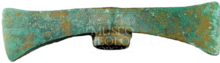
Fig. 3 - Doppia ascia bronzea da Serra Orrios-Dorgali (da http://www.museoarcheologicodorgali.it/wp/museo_archeologia_in_sardegna/la-storia-di-dorgali-in-20-reperti/ ).

Nell'ambito dell'industria metallurgica nuragica le doppie asce appartengono ad una classe di materiali di influenza cipriota, rinvenute in Sardegna, intere o frammentarie, negli insediamenti e nei ripostigli nuragici. Si tratta di attrezzi immanicati al centro, costruiti sul principio di un tagliante sulle due estremità. Si suddividono in base all'andamento del taglio in doppie asce massicce, doppie asce a tagli paralleli e con colletto, doppie asce a tagli ortogonali 1 (figg. 4, 5).