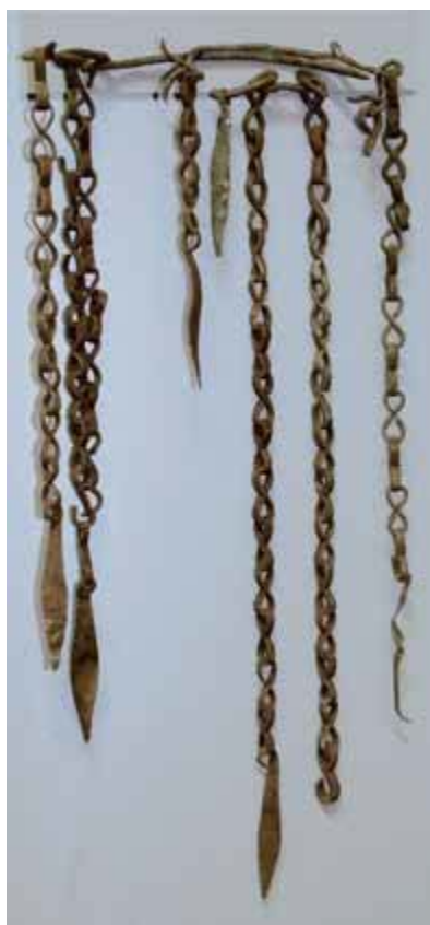
Fig. 5 - Collare in bronzo con catenelle terminanti con elementi foliati dal nuraghe Sanu-Taccu di Osini, esposto al Museo Speleo-Archeologico di Nuoro (da FADDA 2006, fig. 65, p.62).

Anche a livello interpretativo, la funzione di questi oggetti è controversa: la maggior parte degli studiosi 5 è concorde nel ritenerli oggetti ornamentali.