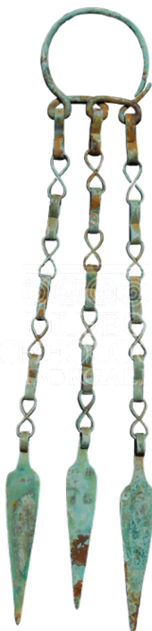
Fig. 1 - Pendaglio da Tillai-Dorgali

Nel sito di Tillai 1 , in territorio di Dorgali, è stato ritrovato un pendaglio 2 a catenelle in bronzo con pendenti laminari e lanceolati (fig. 1), attualmente esposto al Museo Archeologico di Dorgali insieme ad altri di simile fattura provenienti dalla stessa località.