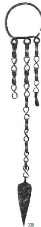
Fig. 4 - Pendaglio a catenelle finienti in lamine lanceolate-Museo archeologico Nazionale di Sassari già Coll. Dessì (da LILLIU 1966, n. 339 p. 448).