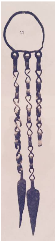
Fig. 3 - Pendaglio a catenelle rinvenuto presso un nuraghe di Tiana (da PINZA 1901, Tav. XVII, p. 171).

Pertanto, sulla base dei dati contestuali al momento disponibili, risulta difficoltosa una precisa attribuzione cronologica e culturale di questo tipo di manufatto: fino a poco tempo fa erano stati datati all'Età Nuragica 3 (VIII-VII secolo a.C.), invece oggi si preferisce inquadrarli nell'ambito dell'Età Altomedievale 4 .