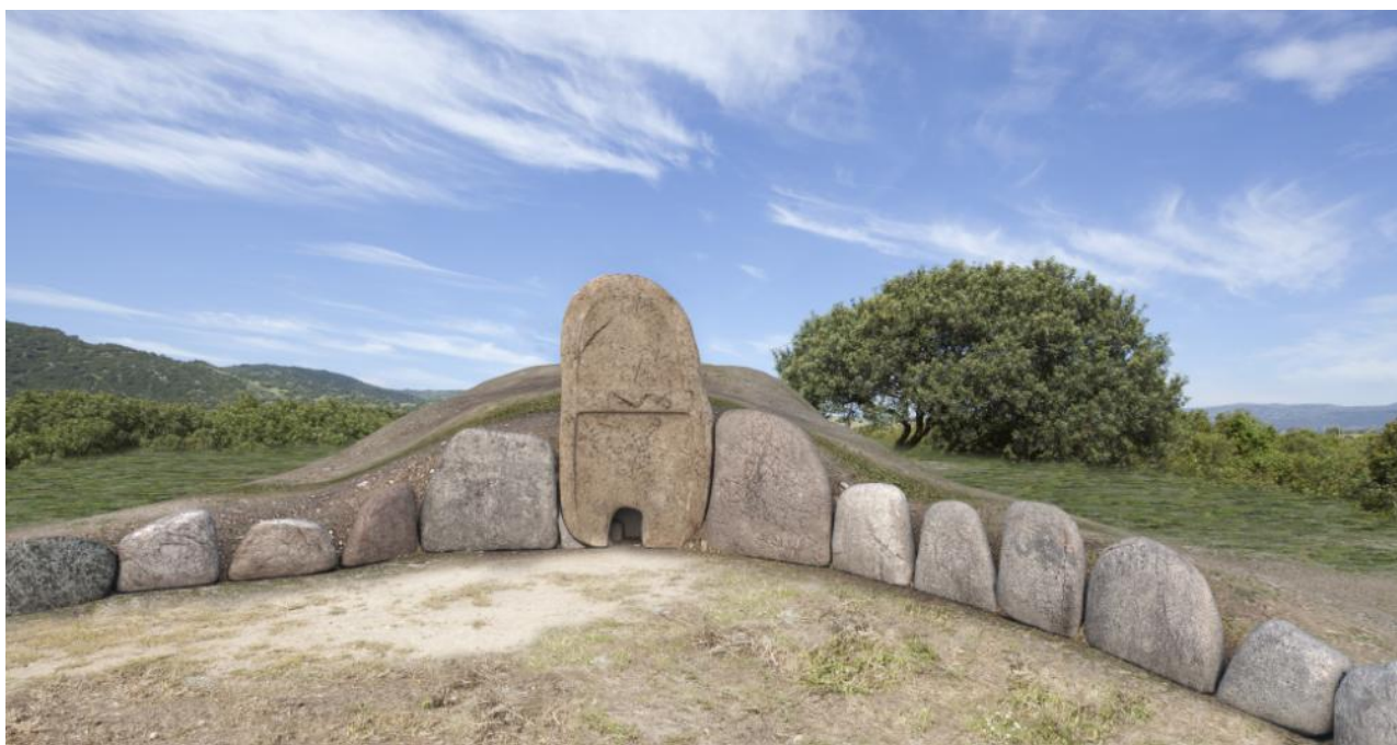
Fig. 2 - Render dello spazio dell'edra della tomba dei giganti di Thomes, Dorgali.

Alta 14 centimetri circa, appartiene alla classe delle ceramiche rivestite del tipo "a vetrina sparsa", così chiamata perché la vetrina, distribuita a chiazze, ricopre soltanto parti della superficie del manufatto 1 . È attestata in Italia durante l'Età Tardo-Antica e Alto-Medioevale. Nei contesti archeologici peninsulari questo tipo di ceramici è attestata ad esempio negli insediamenti toscani di Scarlino-Grossetto e di Rocca San Silvestro-Livorno, e nei centri di Arezzo, Lucca e Chiusi, e più in generale è ben documentata nelle regioni centro-italiche. La bottiglia rinvenuta a Thomes ha fondo piano, apodo, corpo dal profilo subcilindrico raccordato con la spalla tronco-conica, collo cilindrico, orlo leggermente estroflesso. L'impasto è duro, depurato di colore rosso-bruno (figg. 3,4). Alle zone di rivestimento con maggiore spessore corrisponde una vetrina più lucida, di colore verde marcio, ma tuttavia bollosa e irregolare. Le rimanenti zone, maggiormente assorbite dall'impasto, restano opache, con chiazze dalle sfumature di colore giallo-arancio.