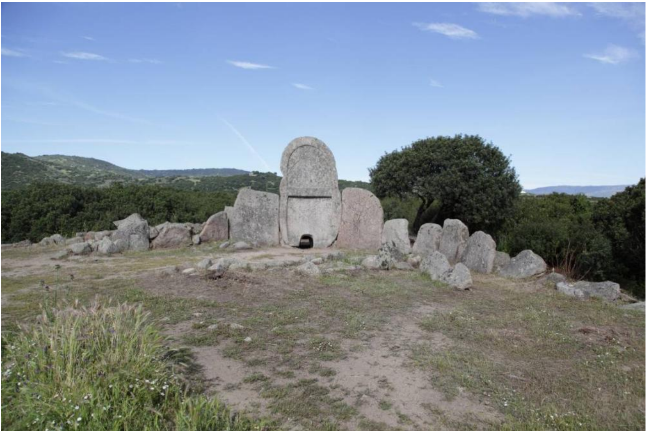
Fig. 1 - Tomba dei giganti di Thomes, Dorgali.

Una bottiglia in ceramica invetriata, recipiente specificatamente usato per contenere liquidi, caratterizzata da un rivestimento piombifero di colore verde, proviene dallo scavo dell'edra della tomba di giganti di Thomes (figg. 1, 2), da un contesto stratigrafico rimessato. Il reperto, danneggiato in fase di recupero, è stato ricomposto immediatamente in situ .