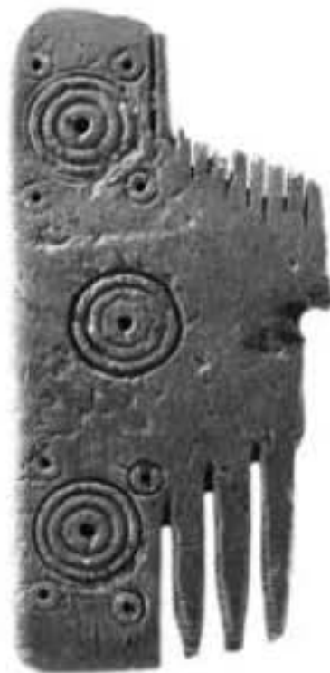
Fig. 4 - Pettine in osso da Santa Filitica (da ROVINA, GARAU, MAMELI, WILKENS, fig. 13.7, p. 264).

Il reperto è esposto al Museo Civico Archeologico di Dorgali.