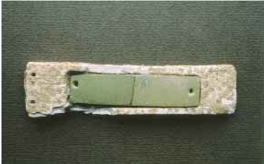
Fig. 2 - Brassard (placca per bracciale di arciere) con custodia in osso decorata ad "occhi di dado", dalla Domus III della necropoli ipogeica di Anghelu Rujù-Alghero (da LILLIU 1999, fig. 173, p. 141).