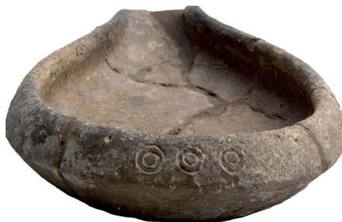
Fig. 3 - Lucerna cuoriforme dal complesso nuragico Su Nuraxi-Barumini datata al IX-VIII secolo a.C. con decorazione a cerchielli a "occhi di dado" (da BAGELLA 2014, p. 261).