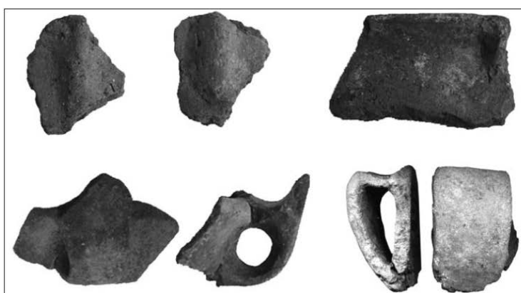
Fig. 5 - Tomba II Sa figu, in territorio di Ittiri, anse a gomito con o senza sopraelevazione asciforme di fase Sa Turracula-Bronzo Medio (da MELIS 2011, FIG. 7, P. 113).

Il tipo di ansa, da riferirsi al periodo di utilizzo della sepoltura, è un tratto distintivo che accomuna quasi tutti i contesti sardi noti inseribili nell'orizzonte ceramico della facies di Sa Turracula (1600-1500 a.C.), tipica delle fasi iniziali del Bronzo Medio (a mero titolo esemplificativo si citano i contesti delle tombe dei giganti di Li Lolghi e Coddu Vecchiu in territorio di Arzachena, di Su Picante in territorio di Siniscola, del dolmen di Mariughia in territorio di Dorgali), associato a forme ceramiche quali tazze, vasi carenati e olle con orlo distinto e corpo globulare (figg. 5, 6).