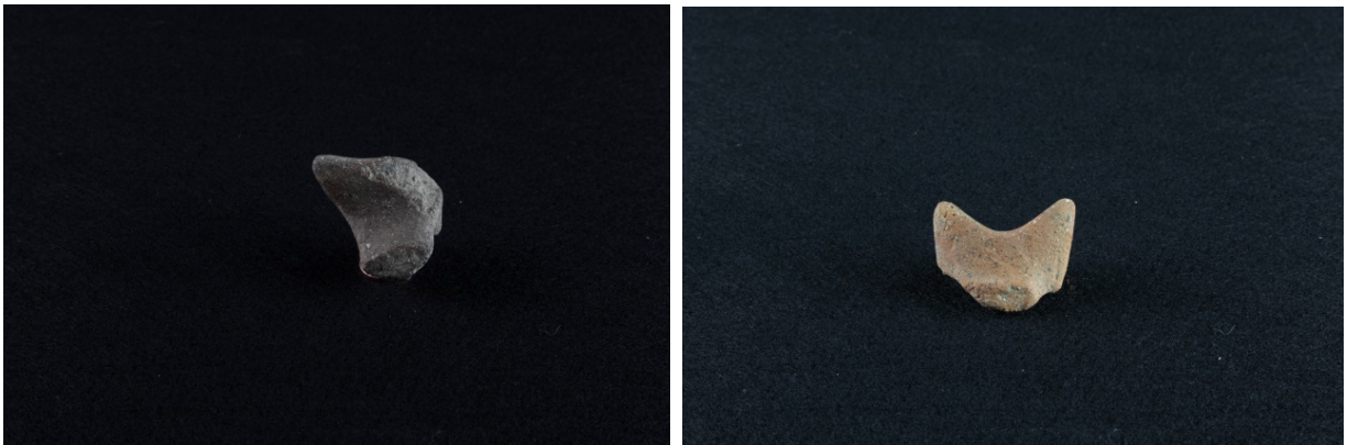
Figg. 1, 2 - Frammenti di ansa sopraelevata con apici cornute da Thomes.

I frammenti ceramici hanno impasti poco depurati con numerosi inclusi, e superfici grossolane lisce, di colore grigio-bruno e rosso-bruno.