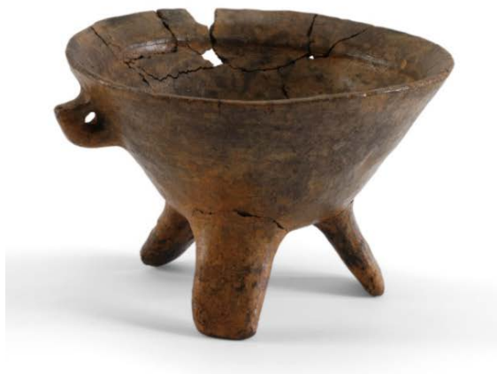
Fig. 4 - Tripode del Bronzo Antico con ansa a gomito con prolungamento asciforme da Grotta loc. Is Carillus di Teulada/Santadi (da MANUNZA 2014, fig. 1, p. 58).