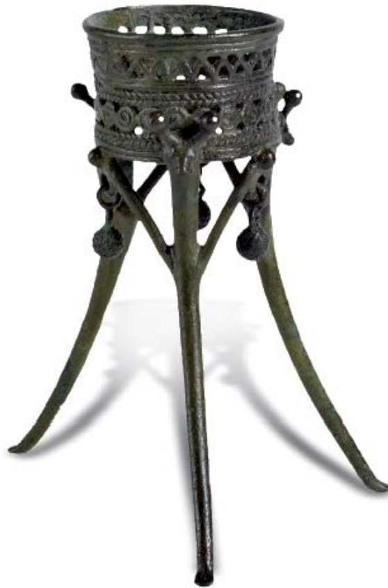
Fig. 5 - Tripode miniaturistico dalla grotta Pirusu-Su Benatzu di Santadi.

Questa forma vascolare scompare nei primi secoli del II millennio a.C., nel corso del Bronzo Medio. Nelle ceramiche della facies culturale degli inizi del Bronzo Medio della Sardegna denominata di Sa Turracula (1600-1500 a.C.), a cui si rimanda il contesto archeologico restituito dalla tomba dei giganti di Thomes, sono attestati dei piedi di vaso tripode a larga fascia un po' insellata di una forma che riporta a modelli calcolitici di Età Monte Claro, e dei quali è finora ignota la sagoma del contenitore sul cui fondo si impostano. Nella civiltà nuragica, nella fase del Bronzo Finale (XII-IX sec. a.C.), sono presenti piccoli sostegni tripodi bronzei votivi, di tradizione cipriota (fig. 5).