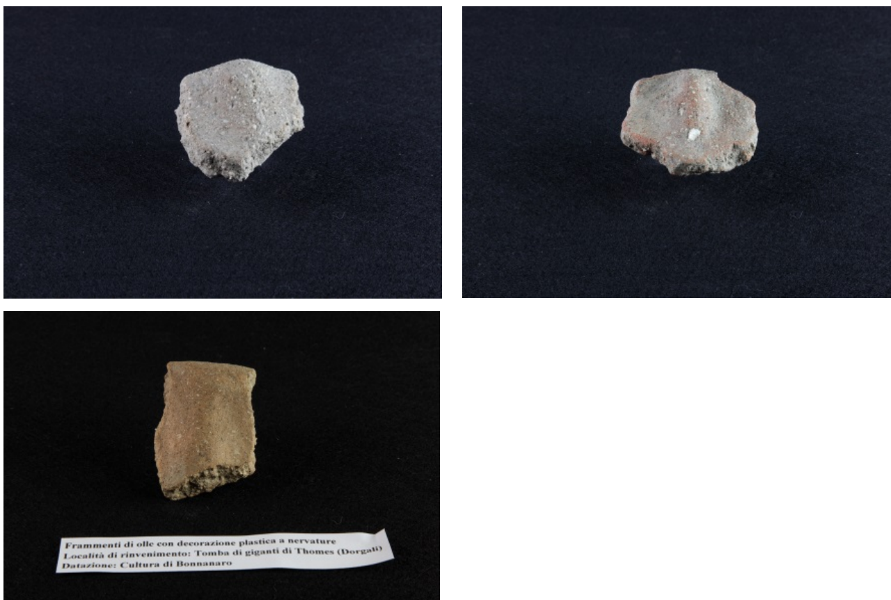
Figg. 1, 2, 3 - Frammenti di pareti di olle da Thomes-Dorgali decorate con motivo a nervature verticali in rilievo sotto l'orlo.

Durante lo scavo della tomba di giganti di Thomes del 1977 si reperirono frammenti di orlo e parete decorati da applicazioni plastiche costituite da motivi a nervature disposti in senso verticale (figg. 1-3), associabili ad una forma ceramica caratteristica nell'ambito vascolare prenuragico e nuragico, l'olla, assai diffuso in contesti funerari di tombe di giganti, ritrovata anche nei villaggi e nei nuraghi.