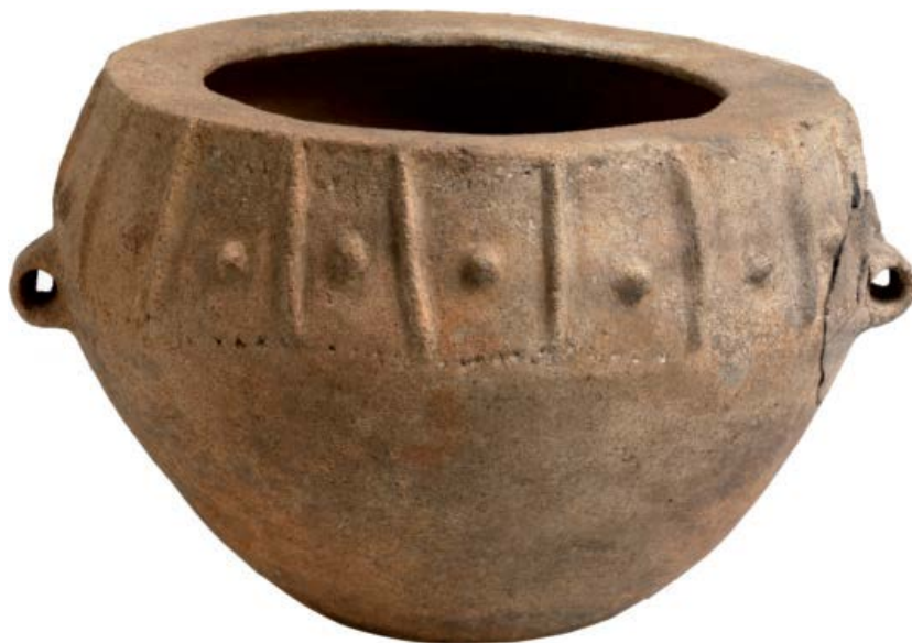
Fig. 4 - Olla biconica a tesa interna della tomba dei giganti 1 di San Cosimo - Gonnosfanadiga secc. XV/XIV a.C. (da BAGELLA 2014, p. 236, scheda 31).

Nella fase piena ed avanzata, invece, compare l'olla ovoide a tesa interna, biconica e biancata, ritrovata ad esempio nella tomba dei giganti a filari di San Cosimo-Gonnosfanadiga (fig. 4), con decorazione plastica a nervature verticali parallele e simmetriche, intervallate a piccole bugne circolari, delimitate inferiormente e superiormente da due file orizzontali di grossi punti impressi.