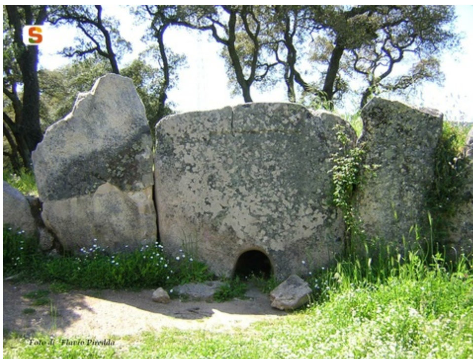
Fig. 1 - Tomba di Pascaredda-Calangianus.

Il cattivo stato di conservazione delle tombe dei giganti, non permette, almeno in parte di ricostruire i riti connessi con il seppellimento del defunto. È possibile che si accedesse alla camera funeraria, come rilevato nella tomba di Pascaredda, in territorio di Calangianus (fig. 1), tramite un elemento amovibile, ligneo o litico, inserito tra i lastroni di chiusura del corridoio funerario. Oltre alla pratica della sepoltura secondaria dei resti scheletrici, secondo la tradizione delle culture dell'ultima Età Calcolitica e del I Bronzo, non mancano tuttavia esempi di inumazione primaria, semi distesa o rannicchiata. I defunti erano deposti senza corredo individuale che li contraddistinguesse; i pochi oggetti di uso quotidiano in ceramica, pietra e metallo, sono riferirsi alla comunità dei defunti.