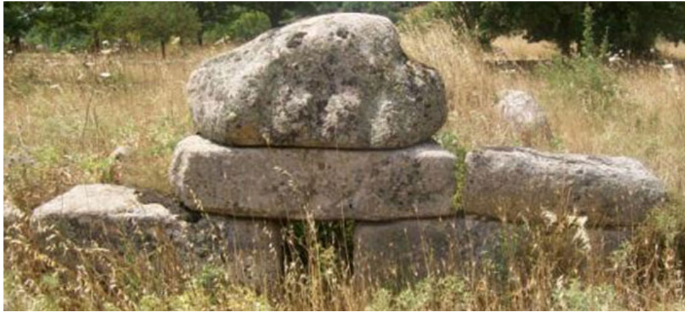
Fig. 4 - Tomba dei giganti di Bidistili-Fonni.