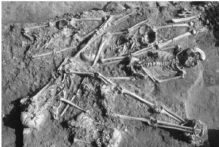
Figg. 2, 3 - Tombe di Sa Sedda 'e Sa Caudela-Collinas

da ATZENI, USAI, BELLINTANI, FONZO, LAI, TYKOT, SETZER, CONGIU, SIMBULA 2012, tav. III p. 40, tav. VIII p. 45).