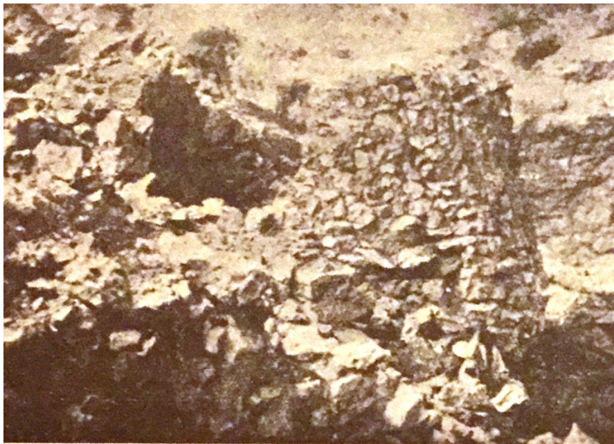
Fig. 2 - Villaggio nuragico di Tiscali (da TARAMELLI 1933, fig. 4, p. 443).