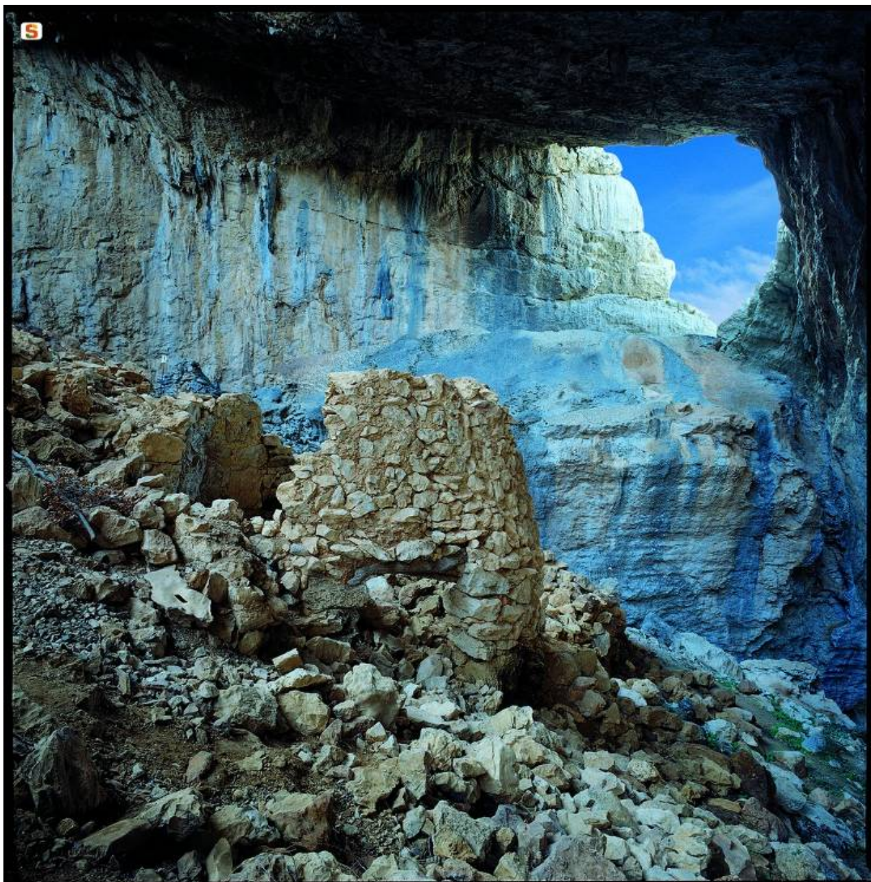
Fig. 1 - Il villaggio di Tiscali (da http://www.sardegna.digitallibrary.it/index.php?xsl=615&s=17&v=9&c=4461&id=103013 ).

Da allora, decenni di incuria e di saccheggi hanno notevolmente danneggiato il sito che nonostante ciò rimane un luogo dall'atmosfera molto suggestiva.