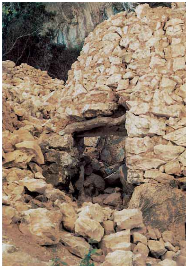
Fig. 4 - Capanna con ingresso architravato in legno del villaggio di Tiscali (da MORAVETTI 2005, fig. 87, p. 102).