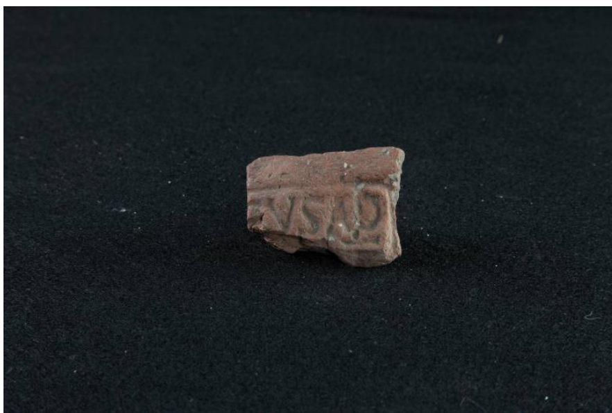
Fig. 2 - Frammento di embrice con bollo impresso in cartiglio rettangolare [EVSAP] rinvenuto nella tomba dei giganti di Thomes-Dorgali (foto di Unicity S.p.A.).

Tra i rinvenimenti più antichi si segnala il ritrovamento in prossimità dell'edra di un frammento di parete di brocchetta acroma (fig. 3), che reca traccia di una iscrizione grafitata riconducibile a contesti del IV-III sec. a.C. (Età Repubblicana).