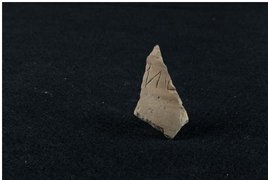
Fig. 3 - Frammento di parete di brocchetta acroma con iscrizione latina incisa da Thomes-Dorgali.

Tra i rinvenimenti più antichi si segnala il ritrovamento in prossimità dell'edra di un frammento di parete di brocchetta acroma (fig. 3), che reca traccia di una iscrizione grafitata riconducibile a contesti del IV-III sec. a.C. (Età Repubblicana).