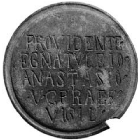
Fig. 2 - Disco in bronzo con iscrizione tardo-romana da Siddai-Dorgali (da DELUSSU, IBBA 2012, fig. 2, p. 2197).