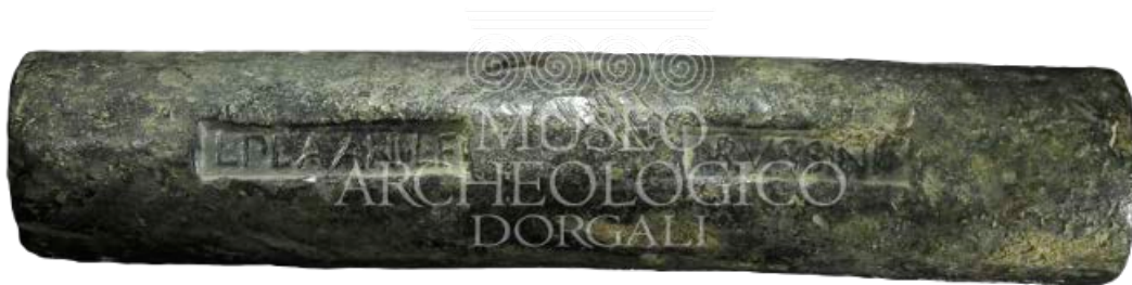
Fig. 3 - Lingotto plumbeo recuperato nelle acque prospicienti Cala Cartoe-Dorgali datato al II-I secolo a.C..

Una delle località alle quali si deve far riferimento per definire la storia del paesaggio e la geografia del territorio, è quella della stazione romana Viniolae in agro di Dorgali (sito di Finiodda, valle dell'Oddoene), citata dall'Itinerario Antoniniano, ubicata lungo l' iter a Portu Tibulas Karalis . E proprio in prossimità di questo tracciato viario, il quale si sviluppava lungo la costa orientale della Sardegna, che gli insediamenti prevalentemente noti si distribuiscono. Altri siti sono stati riconosciuti presso i due diverticula , ossia le diramazioni trasversali dirette verso l'interno, in direzione della valle di Isalle e di Oliena, verso la Barbagia interna.