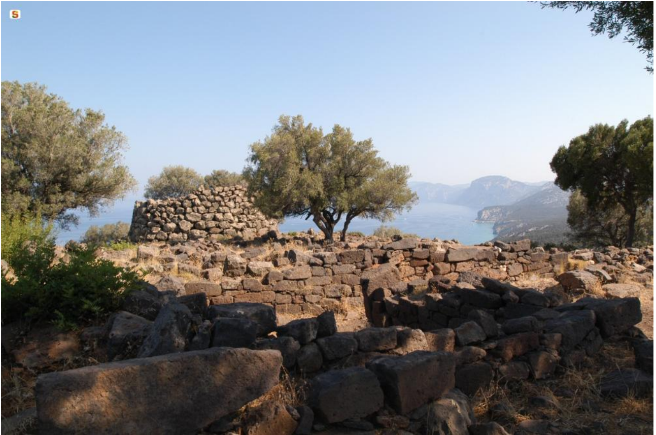
Fig. 3 - Nuraghe Mannu-Dorgali.

L' insediamento di Età Romana (fig. 4), databile tra l'Età Repubblicana e la tarda Età Imperiale (II sec. a.C. - VI sec. d.C.), include abitazioni a due vani edificate con muri in tecnica isodoma, spesso reimpiegati, e con pietre semilavorate, posti in opera a secco, coperti con tetti a di tegole e coppi, sorretti da travi lignee, a singolo o a doppio spiovente.