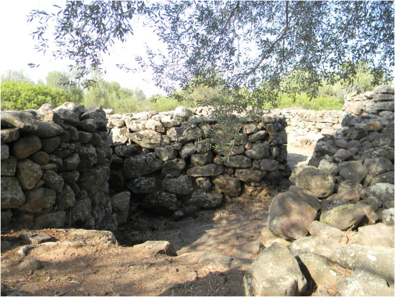
Fig. 3 - Le capanne del villaggio di Serra Orrios-Dorgali.

In posizione isolata si trova una supposta capanna delle riunioni destinata ad essere utilizzata in occasione di cerimonie collettive, di forma pseudo-ellittica, preceduta da vestibolo ad ali ricurve realizzato con lastroni ortostatici, con sedile-bancone che si sviluppa lungo tutto il profilo murario.