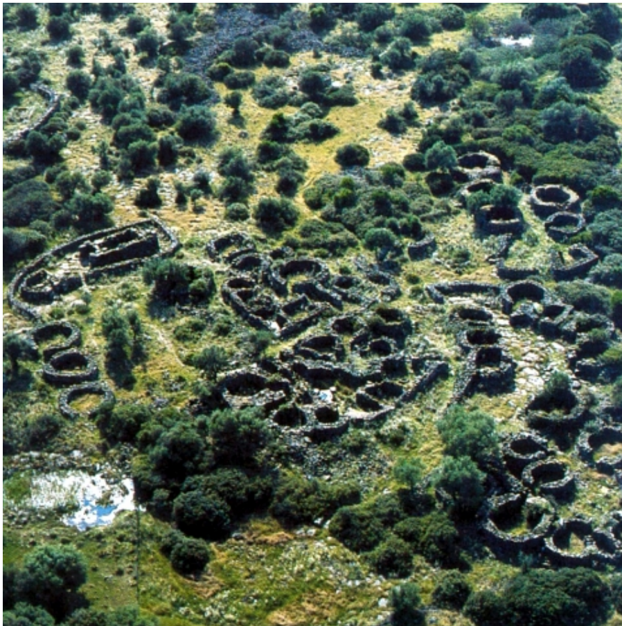
Fig. 1 - Veduta aerea del sito di Serra Orrios-Dorgali.