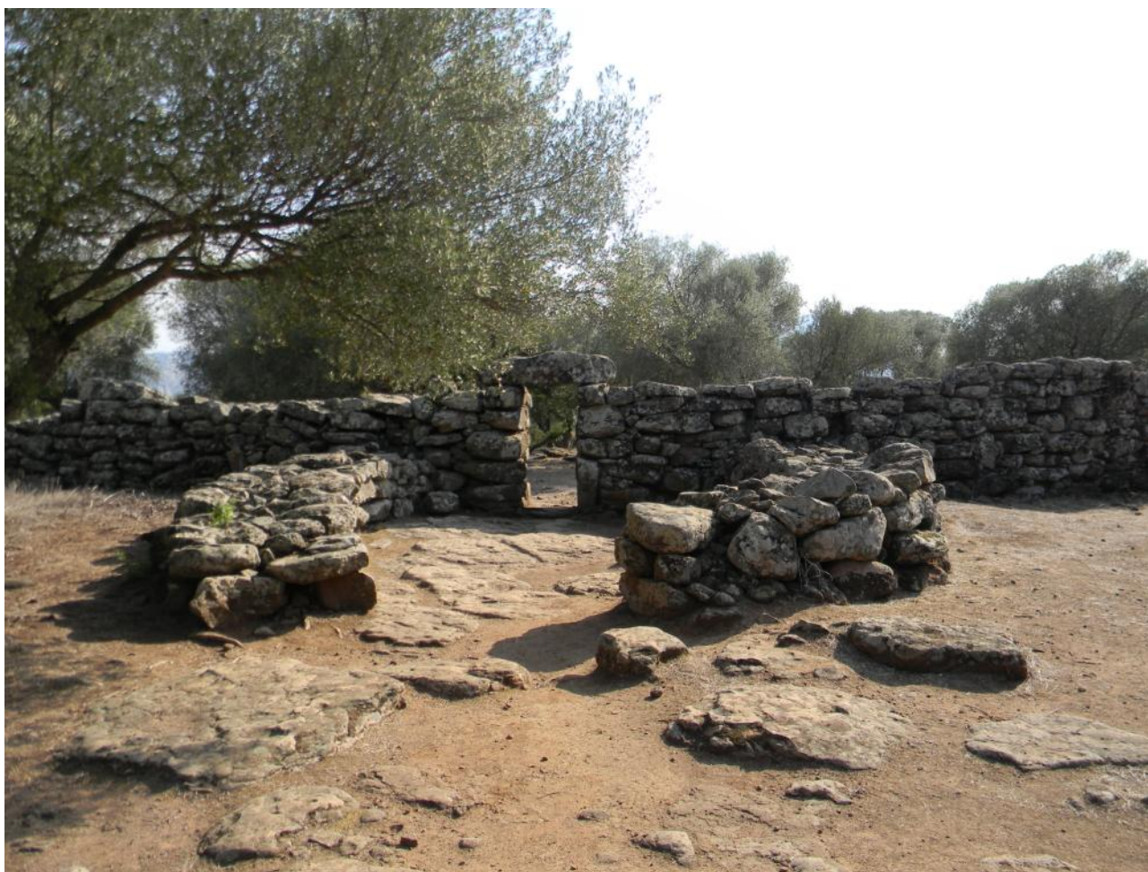
Fig. 4 - Ingresso al recinto A al cui interno è stato rinvenuto un tempio a megaron.

I materiali rinvenuti a Serra Orrios, tutti ascrivibili all'orizzonte nuragico, piuttosto limitati rispetto all'ampiezza della sua estensione, documentano attività legate all'ambito domestico, all'industria metallurgica, alla lavorazione delle pelli, all'agricoltura, e alla macinazione dei cereali, e si inquadrano in un arco cronologico compreso tra il Bronzo Medio e l'Età del Ferro (XVII-VIII/VI sec. a.C.).