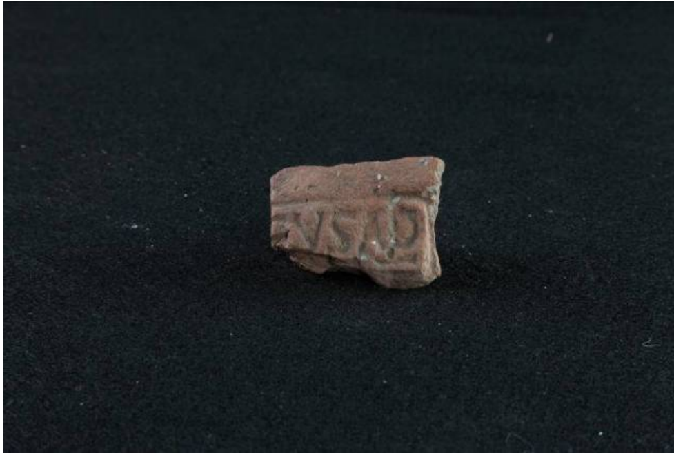
Fig. 2 - Frammento di embrice con bollo impresso in cartiglio rettangolare [EVSAP] rinvenuto nella tomba dei giganti di Thomes-Dorgali.

La frequentazione della tomba in Età Alto Medievale potrebbe essere giustificata dalla vicinanza dei due abitati medievali di Nurule e Isarle (fig. 3).