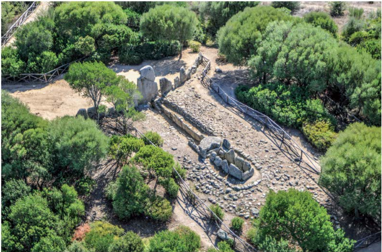
Fig. 2 - Tomba dei giganti Li Lolghi-Arzachena (da MORAVETTI 2014, p.53).

La tipologia monumentale, di derivazione dolmenica, è in sintesi l'evoluzione delle tombe a galleria coperta, le alleè couverte . Sono costituite da un lungo corpo generalmente absidato, e fronte arcuata che si prolunga lateralmente in due ali di muro delimitante un'area cerimoniale chiamata esedra. Il monumento presenta al centro dell'esedra la massima altezza che diminuisce progressivamente sia verso le estremità delle ali sia verso l'abside. Nella Sardegna centro-settentrionale, nel corso del Bronzo Medio II (1400-1300 a.C.), alla tomba ad ortostati con stele centinata (fig. 2) subentrerà, un tipo tombale edificato in muratura in tecnica isodoma o a blocchi poligonali, senza stele, con ingresso sormontato da un architrave (figg. 3, 4).