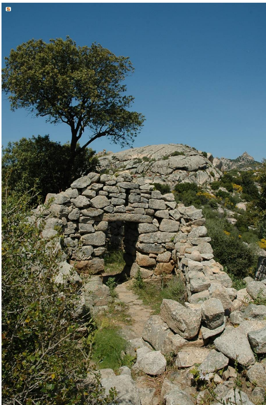
Fig. 4 - Il tempietto di Malchittu-Arzachena.

Per quanto attiene la produzione vascolare la facies di Sa Turricola è ben distinguibile sulla base di forme semplici, come tazze troncoconiche e bassi tegami e sulla persistenza di elementi formali più antichi quali le anse a gomito.