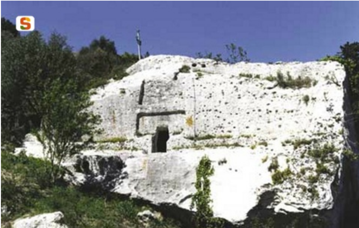
Fig. 3 - Tomba a prospetto architettonico di Sas Puntas, in territorio di Tissi che riproduce integralmente una tomba di giganti sia nella facciata a esedra sia all'interno.

Nella parte nord-occidentale dell'Isola, in un'area piuttosto ristretta (Sassarese e Logudoro settentrionale), questo tipo di tomba di giganti verrà per la maggior parte riprodotta in roccia, realizzando tombe ipogee scavate nella roccia con facciata architettonica e spesso riutilizzando precedenti domus de janas (fig. 3).