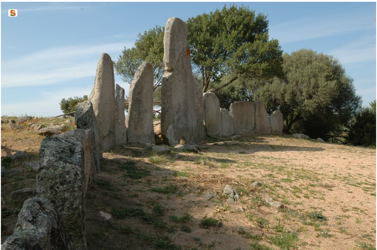
Fig. 2 - Tomba dei giganti di Li Lolghi-Arzachena.

Dalle limitate indagini sugli abitati del Bronzo Medio emerge che le capanne delle aree montane e collinari, a un solo vano e a destinazione unifamiliare, hanno lo zoccolo di base in muratura. La capanna dal profilo rettangolare absidato di Sa Turracula, in parte scavata nella roccia e in parte delimitata da uno zoccolo murario, è provvista di focolare e di sottofondo pavimentale in pietre. L'alzato murario e la copertura poteva essere realizzata con un'intelaiatura di rami e intrecci di canne e frasche, impermeabilizzate con argilla. Nella Sardegna centro-settentrionale, alle soglie dell'età nuragica, a partire dalla facies di Sa Turracula (Bronzo Medio I) si diffondono le tombe di giganti caratterizzate da struttura ortostatica e stele centinata al centro dell'essedra cerimoniale (come nell'esemplare di Thomes-Dorgali o di Li Lolghi-Arzachena). Si tratta di tombe collettive, nelle quali un gruppo umano, stanziato in un determinato territorio, seppelliva i propri morti per diverse generazioni (fig. 2).