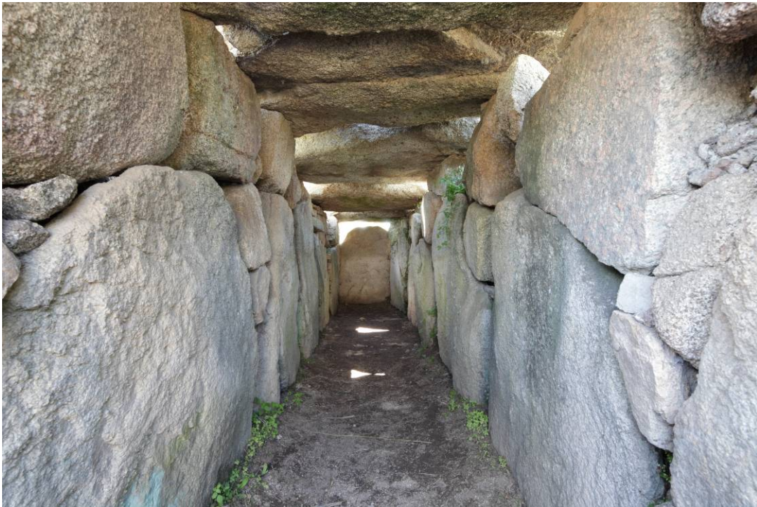
Fig. 5 - Interno della camera funeraria.