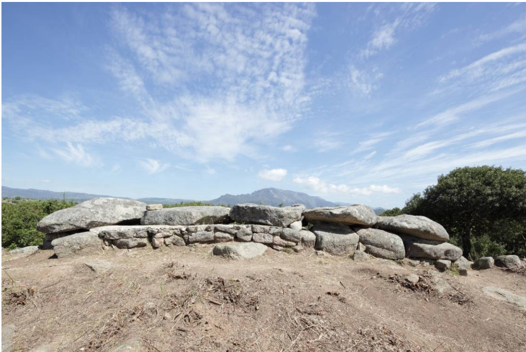
Fig. 3 - Veduta laterale del monumento che mostra il particolare della copertura.