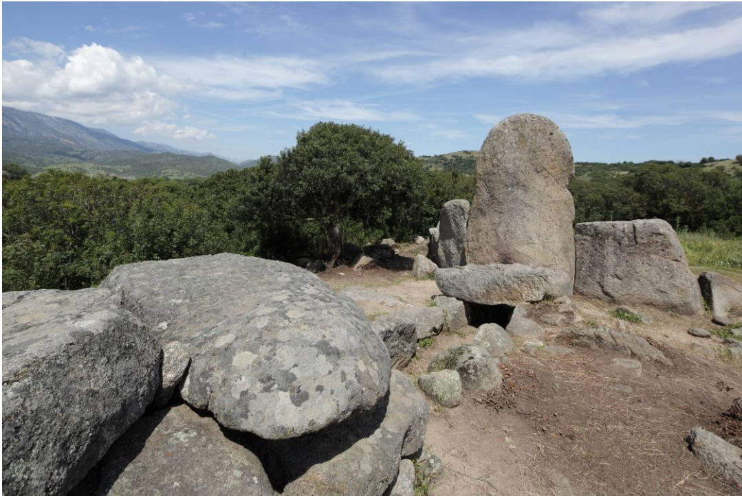
Fig. 2 - Corridoio funerario visto da dietro.