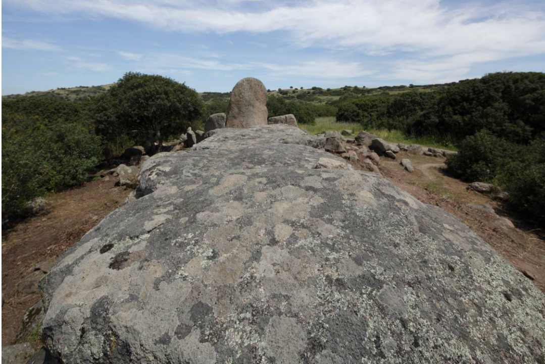
Fig. 4 - Particolare sulle grandi lastre granitiche di copertura.