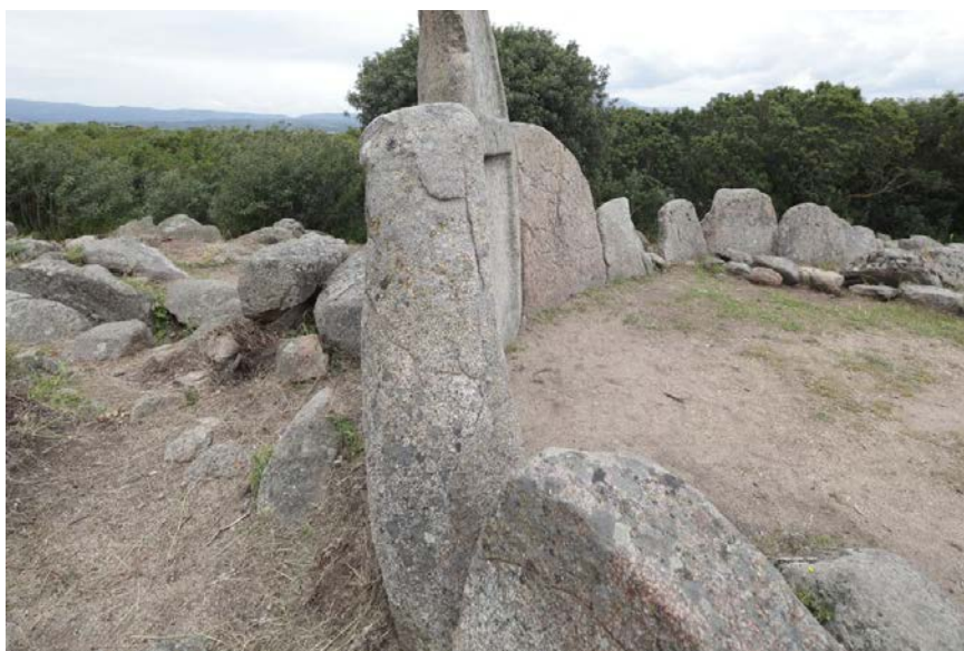
Fig. 2 - Profilo dell'esedra della tomba dei giganti di Thomes.

L'ortostato centrale coincide con l'ingresso e con la stele centinata (fig. 3).