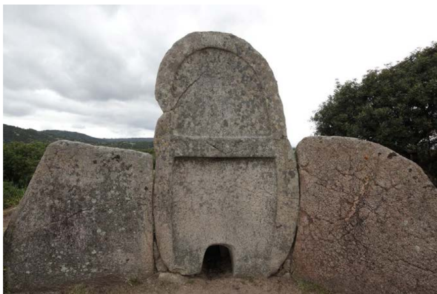
Fig. 3 - Ingresso alla tomba di Thomes (foto di Unicity S.p.A.).

L'ortostato centrale coincide con l'ingresso e con la stele centinata (fig. 3).