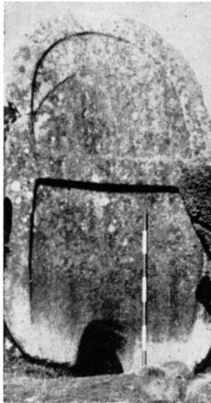
Fig. 1 - Stele centinata della tomba dei giganti di Thomes (da LILLIU 1970, fig. 26, p. 116).

'e Thomes, il cui toponimo ricorda rigagnoli sotterranei di acque sorgive che scorrono nelle sue vicinanze. Il monumento, certamente noto fin dagli inizi del secolo scorso, fu menzionato per la prima volta nel 1967 da Giovanni Lilliu, l'archeologo scopritore della reggia nuragica di Barumini (fig. 1) a proposito di Rapporti architettonici sardo-maltesi e balearico-maltesi nel quadro dell'ipogeismo e del megalitismo 5 . Lilliu della singolare e inedita stele centinata in granito a due elementi composti, con portello alla base, che caratterizza il monumento, ci fornisce dettagli utili sulla sua consistente mole: "alta m. 3,65, larga m. 2,10 (a un terzo dell'altezza), spessa 0,40. Ha una cubatura di mc. 3,066 e un peso di t. 7,051. Il portello, all'esterno, è alto e largo m. 0,50".