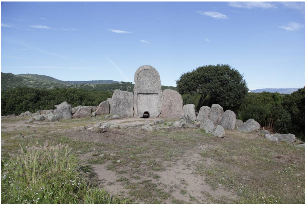
Fig. 4 - Esedra.

L'ortostato centrale coincide con l'ingresso e con la stele centinata. Non è presente un bancone sedile. Presenta una corda di 10,20 metri ed una freccia di 4,20 metri 2 .