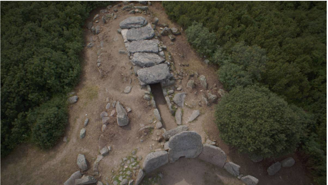
Fig.1 - Veduta dall'alto della tomba.

Fu scavata e restaurata da Francesco Nicosia, allora Soprintendente Archeologico per le province di Sassari e Nuoro, durante l'estate dell'anno 1977. Riguardo le attività del cantiere, gli appunti annotati in un taccuino da Nicosia, il cosiddetto giornale di scavo, unitamente al registro reperti, sono stati un importante fonte documentaria 1 che ha consentito di comprendere meglio la strategia che accompagnò quell'indagine, i cui tempi di esecuzione furono piuttosto brevi (figg. 3-8).