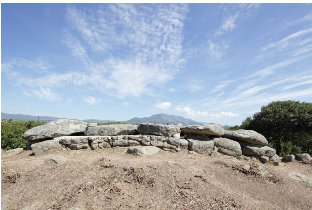
Fig. 8 - Veduta laterale del monumento che mostra il particolare della copertura.