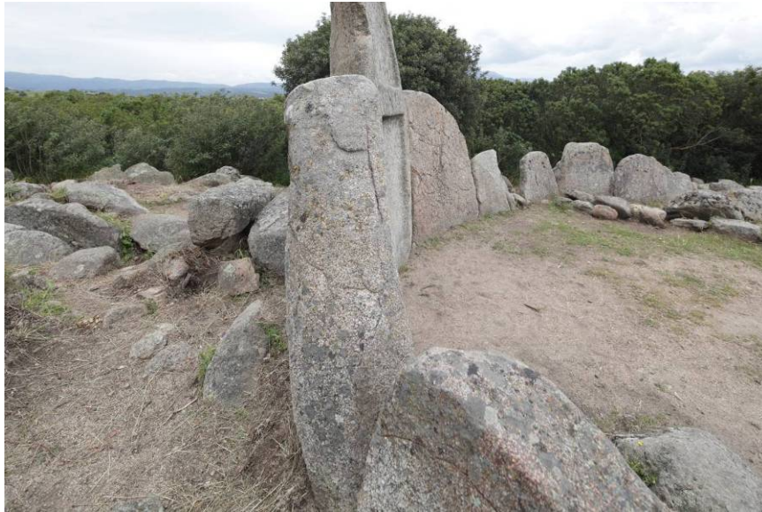
Fig. 3 - Profilo dell'esedra della tomba dei giganti di Thomes.

L'ortostato centrale coincide con l'ingresso e con la stele centinata. Non è presente un bancone sedile. Presenta una corda di 10,20 metri ed una freccia di 4,20 metri 2 .