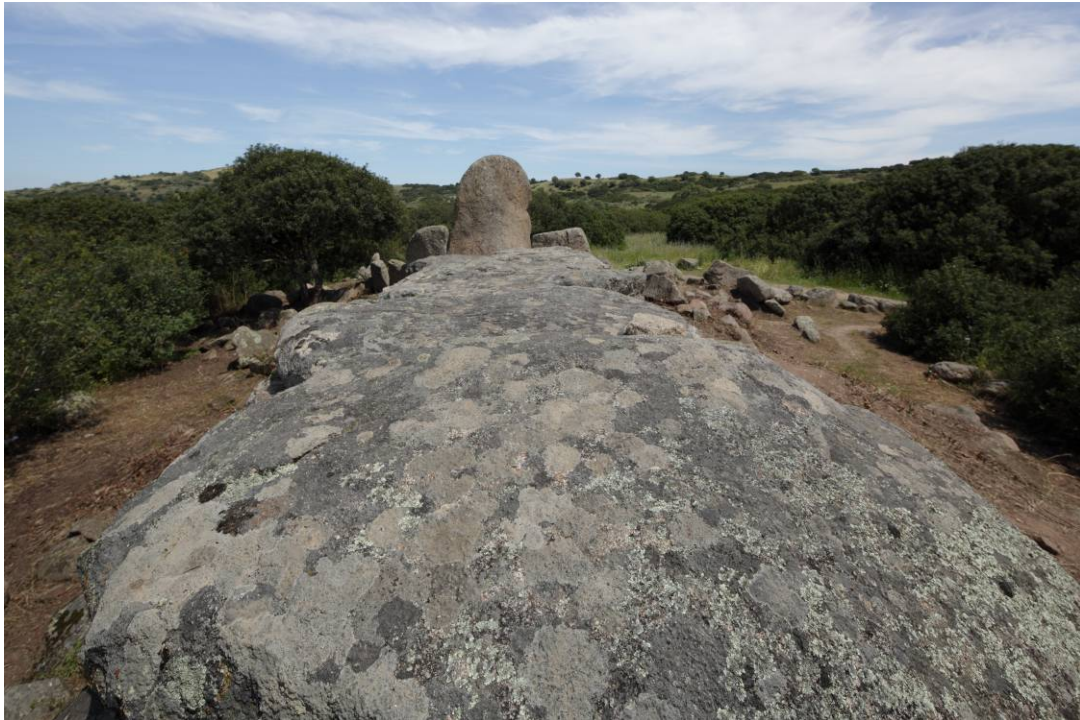
Fig. 9 - Particolare sulle grandi lastre granitiche di copertura.

Dalla lettura del giornale di scavo si evince che il pavimento, interessato nel corso del tempo da pregressi scavi clandestini, presentava traccia dell'originaria pavimentazione a lastre di granito. Un tumulo ricopriva anche la tomba dei giganti di Thomes di modo che, allo stesso tempo, venisse nascosta ed evidenziata: difatti, esso serviva anche a conferire allo stesso sepolcro un effetto di monumentalità e visibilità (fig. 10).