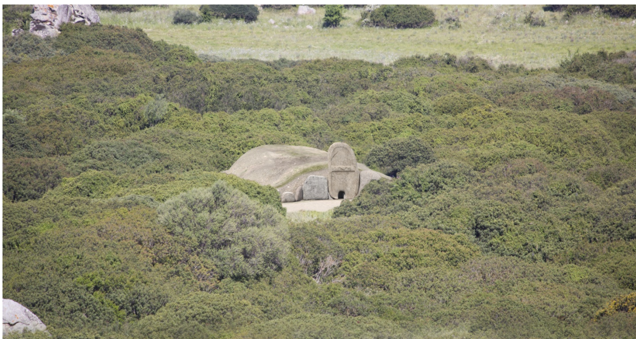
Fig. 2 - Ipotesi di ricostruzione del monumento (foto di Unicity S.p.A.).

Prima dell'intervento la tomba si presentava danneggiata in più punti: gli ortostati della facciata erano sconnessi, la stele era piuttosto inclinata. Il corridoio funerario, in parte scoperchiato e privo di alcuni lastroni della copertura, spostati dalla loro locazione originaria a seguito di scassi clandestini. I lavori di restauro consentirono di ricostruire pressoché l'intera struttura (raddrizzamento della stele, riallineamento degli ortostati alla facciata dell'edra, ricostruzione parziale del muro interno del corridoio funerario e risistemazione della copertura di quest'ultimo), e di constatare alcuni accorgimenti tecnici utilizzati per la sua costruzione. La fronte del monumento funerario, realizzato interamente in granito locale, presenta un'edra semicircolare, del tipo a ortostati. Si compone di una serie di lastre di altezza degradante, a partire dalla stele verso l'esterno (figg. 3, 4).