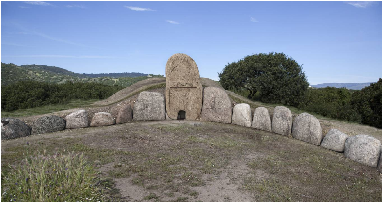
Fig.10 - Ipotesi di ricostruzione del monumento.

Lo scavo, che ha interessato l'edera, la camera funeraria e la crepidine di pietre su cui si innalzava il tumulo ha restituito una sequenza stratigrafica piuttosto semplice, contraddistinta da una sostanziale manomissione della situazione originaria in particolar modo nell'edera e nella camera. Nel complesso i reperti emersi durante lo scavo (quali ad esempio frammenti ceramici, uno spillone bronzeo, embrici, coppi, monete), compresi quelli della ricognizione di superficie consentono di ipotizzare la costruzione e l'utilizzo della tomba durante la facies del Bronzo Medio di Sa Turrucula 3 (1600-1500 a.C.), e un uso della stessa che si protrae fino ad Età Storica. Difatti, della frequentazione in Epoca Romana e Altomedievale residuano ancora oggi le tracce di un insediamento in parte addossato alla stessa tomba (III sec. a.C. e il VI/VII sec. d.C.).