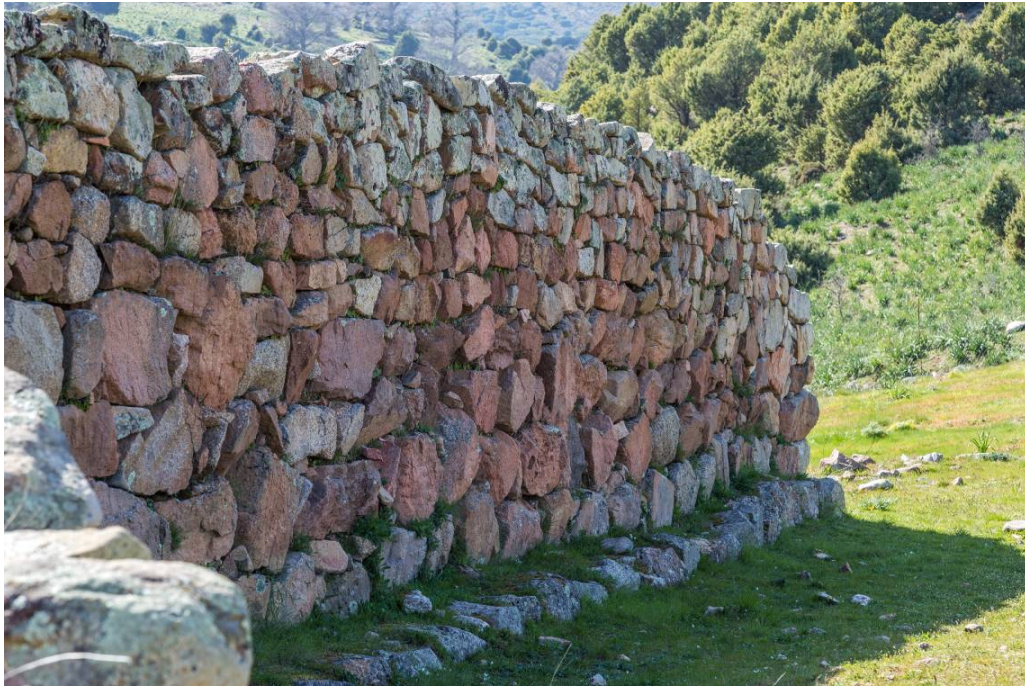
Fig. 2 - Particolare dell'area esterna del tempio a megaron 1.

Quest'ultimo fu posto in relazione proprio con la distruzione dell'intelaiatura lignea data da pali lignei e frasche, equivalente all'originaria copertura del tetto a doppio spiovente, completata dall'aggetto realizzato con la messa in posa delle lastre litiche (fig. 3).