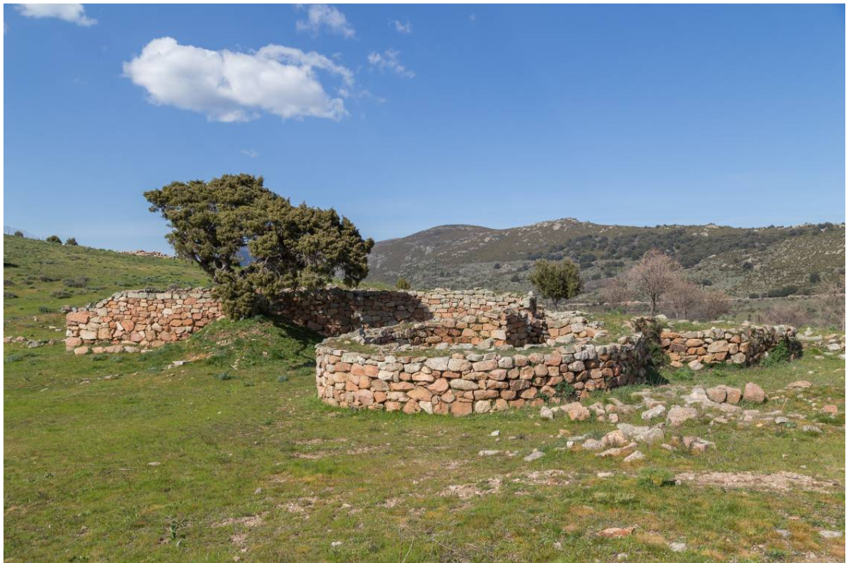
Fig. 1 - Panoramica dell'area esterna del tempio a megaron 1.

L'indagine di scavo ha permesso di datare l'edificio templare megaron 1 ad un periodo compreso tra il Bronzo Recente-Finale e la Prima Età del Ferro, identificando due fasi costruttive differenti, di cui la seconda susseguitasi alla distruzione del villaggio a causa di un incendio (fig. 1).