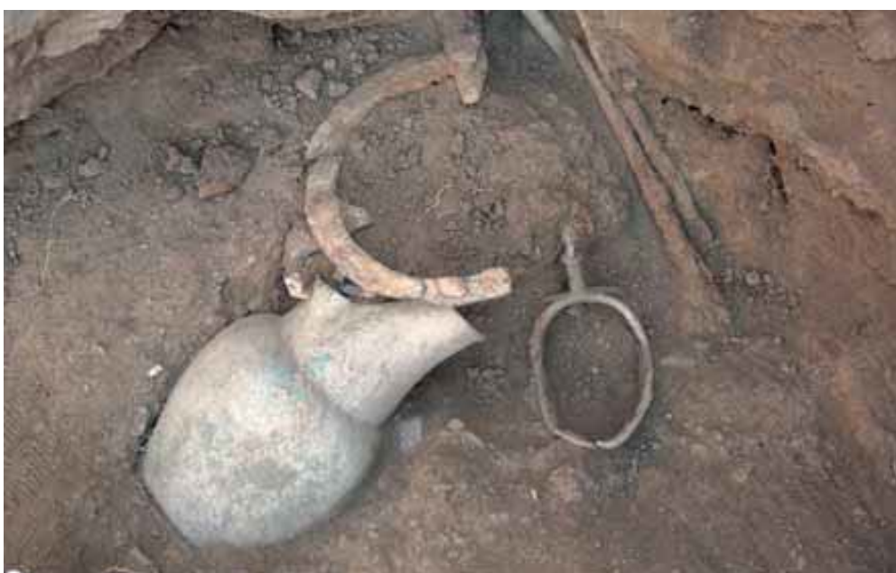
Fig. 3 - Brocca di bronzo, tripode di ferro e navicella di bronzo dal ripostiglio 3 (da FADDA 2012, fig. 96, p. 76).

Emerge quindi l'immagine di un complesso culturale fiorente, basato su un modello di organizzazione socio-economica ben strutturato e capace di gestire le ingenti risorse circolanti, la pluralità di attività artigianali specializzate, e la cospicua forza-lavoro necessaria per la realizzazione e la manutenzione delle strutture identificate dagli scavi ( insulae , aree di culto etc.).