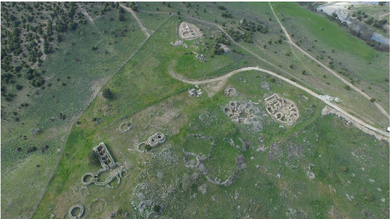
Fig. 1 - Foto area del sito di S'Arcu'e Is Forros.

Il quadro delle scoperte relative al santuario nuragico di S'Arcu 'e is Forros (fig. 1), nella fase che abbraccia la fine dell'Età del Bronzo Finale e la Prima Età del Ferro, rivela il sito come un centro di raccolta di beni di pregio e di consumo sotto forma di offerte di indubbia valenza sacrale, e quindi come luogo di accumulo di manufatti sia integri che frammentari destinati ad una successiva rifusione, di tesaurizzazione e di gestione di ricchezze come ricco repertorio di deposizioni votive, in stretto rapporto di scambi continuativi con l'Etruria e il Levante.