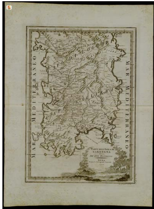
Fig. 1 - Il Giudicato di Ogliastra cartografato nell'opera del 1792 Parte dell'Isola di Sardegna Divisa n'e suoi Distretti di Cassini Giovanni Maria (da http://www.sardegna.digitalibrary.it/index.php?xsl=626&s=17&v=9&c=4461&id=13571 ).

A partire dai primi decenni del XIV secolo entrò a far parte dei possedimenti del Regno catalano-aragonese di Sardegna, che lo concedettero in feudo al conte di Quirra Berengario Carroz. Dal 1361 al 1409 assunse la fisionomia curatoriale arborense. In seguito tornò ai Carroz di Quirra. Nella concessione dell'allodio di Ferdinando di Aragona a favore di Violante Carroz del 1504, al feudo di Villa Strisaili succedette l'allodio di Biddanoa Strisaili, corrispondente all'attuale frazione di Villanova Strisaili.