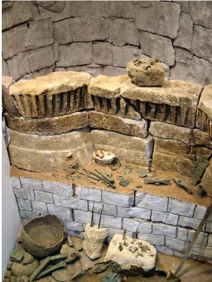
Fig. 2 - Ricostruzione del deposito votivo del tempio di Sa Carcaredda.

Dallo scavo del complesso nuragico provengono oggetti rituali, quali bottoni bronzei sormontati da protomi zoomorfe, stilette e faretrine votive, bronzi figurati (figure di offerenti e animali), pugnali, puntali di lancia, asce, armille, ed elementi di collana in ambra e cristallo di rocca, databili tra il XII e il VII secolo a.C. (fig. 3).