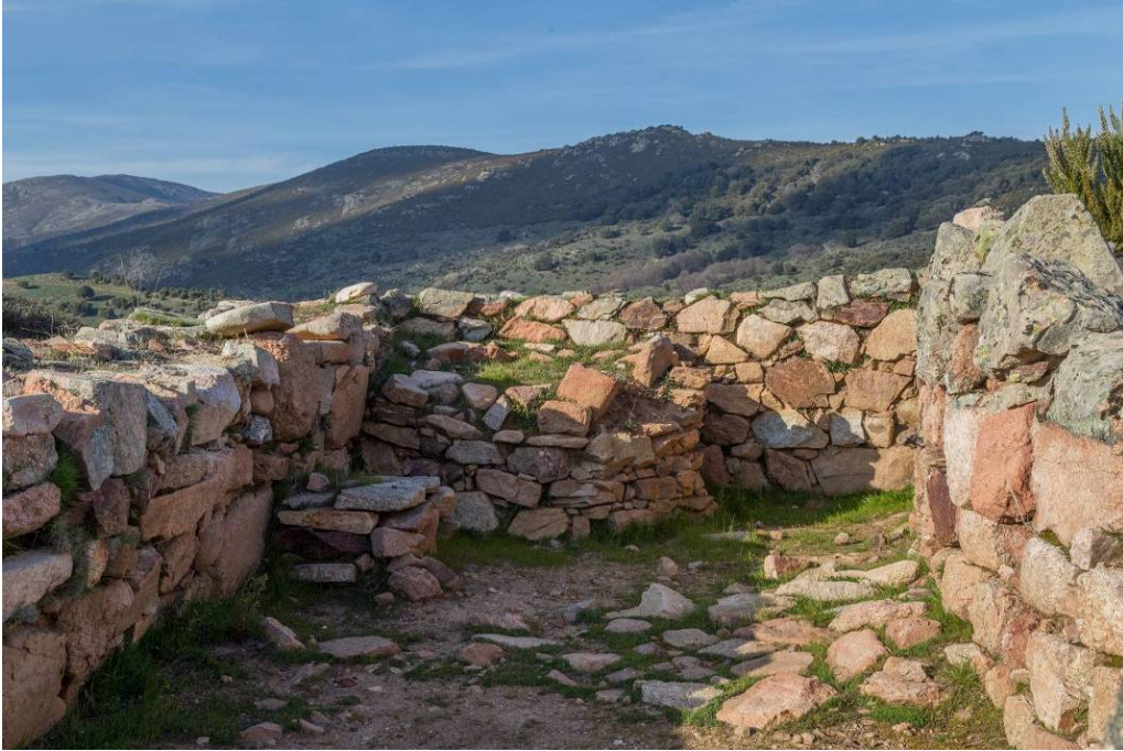
Fig. 3 - Megaron 3 (foto di Unicity S.p.A.).

Sul piano dell'antica fornace, ancora conservato, si realizzavano i nuovi strati di lavorazione dei metalli, rinnovando ogni volta il piano d'argilla concotta alla base; sul lato Nord-Ovest, in uno spazio lasciato aperto, leggermente concavo, avveniva l'inserimento degli ugelli del mantice che alimentavano il fuoco (fig. 4).