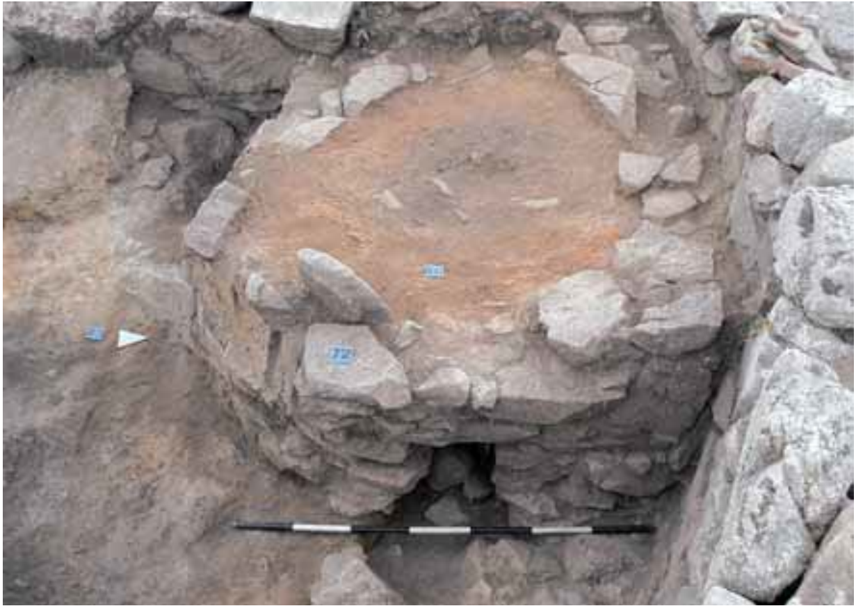
Fig. 4 - Forno a camino (da FADDA 2012, fig. 51, p. 36).