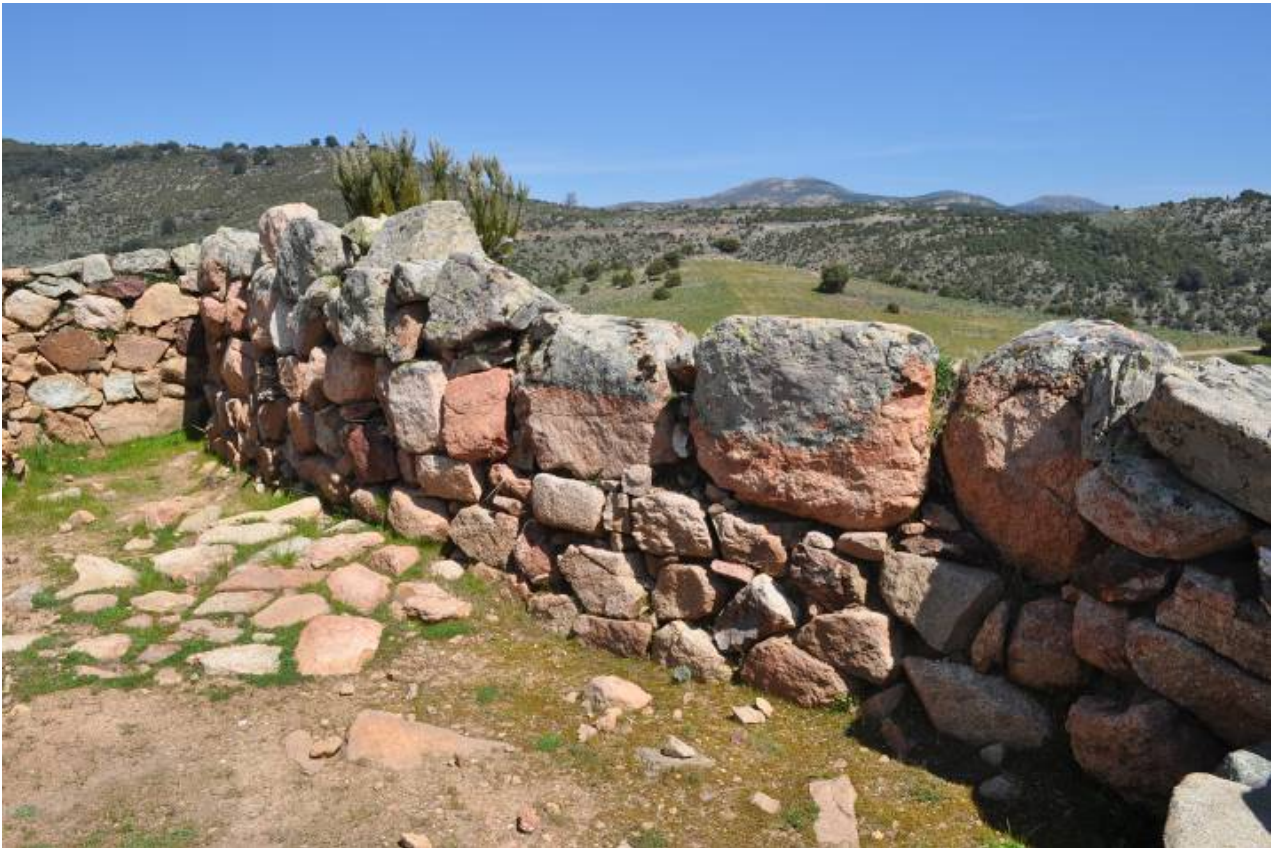
Fig. 2 - Interno del megaron 3, pavimentazione e opera muraria.

un consistente strato del battuto di argilla rossa, contraddistinto da livelli alternati di argilla bruciata, imputabili alla risistemazione dello stesso pavimento e all'allestimento di piccole fornaci a basso fuoco appoggiate al muro (fig. 2).