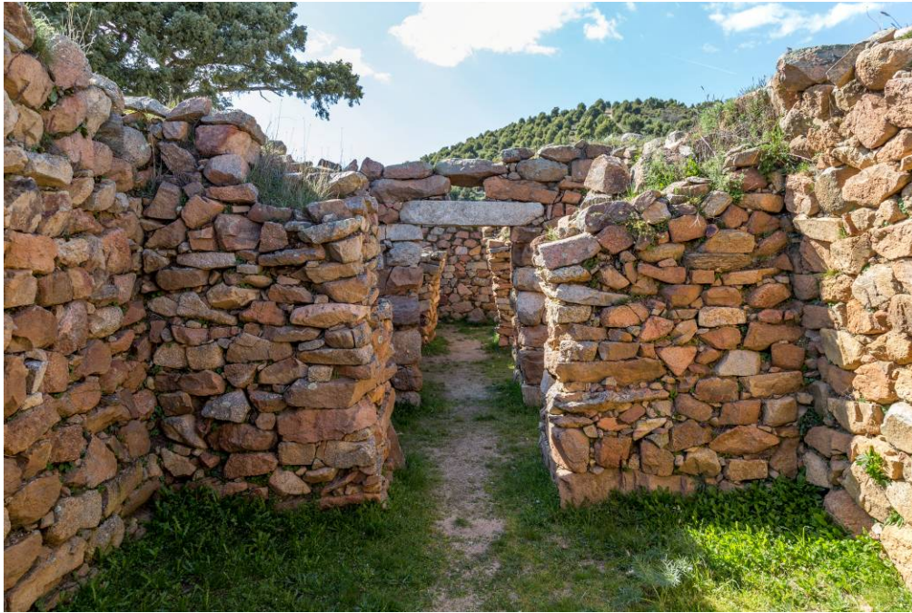
Fig. 2 - Interno del tempio a megaron 1. In fondo il vano D.

Si conserva ancora parte dell'originario pavimento lastricato. Nel muro di fondo si trova una piccola nicchia sopraelevata di forma sub-trapezoidale, che risulta perfettamente in linea con tutti i corridoi dei vani del tempio (fig. 3).