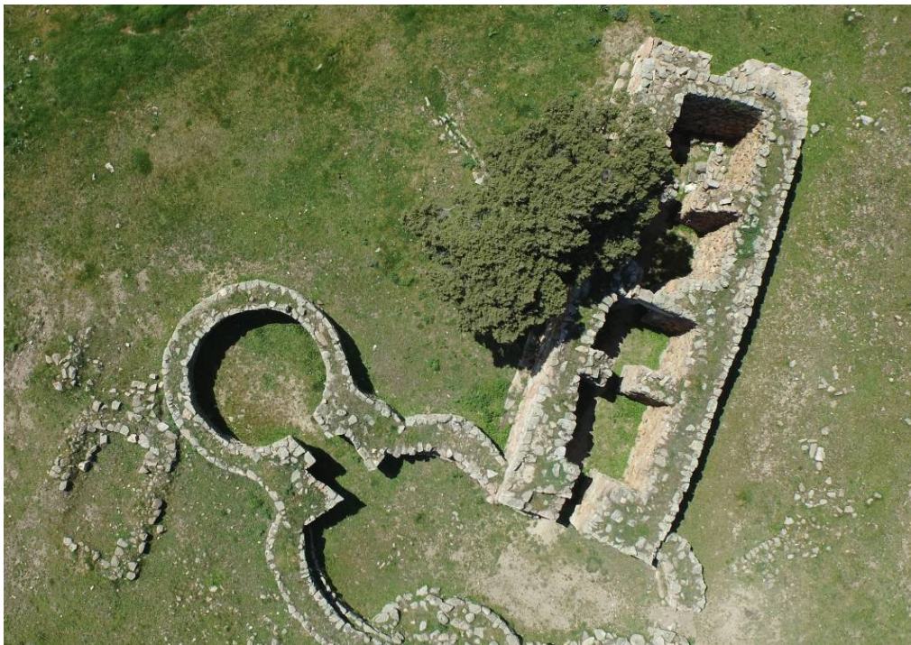
Fig. 3 - Veduta dall'alto del tempio a megaron 1.

Si conserva ancora parte dell'originario pavimento lastricato. Nel muro di fondo si trova una piccola nicchia sopraelevata di forma sub-trapezoidale, che risulta perfettamente in linea con tutti i corridoi dei vani del tempio (fig. 3).