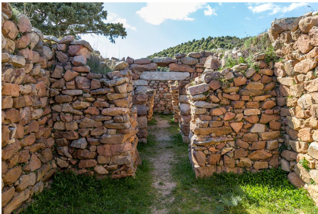
Fig. 1 - Interno del tempio a megaron 1.

I muri perimetrali interni, intonacati, sono fortemente aggettanti e resi più stabili alla base da uno zoccolo lapideo sporgente di ricalzo utilizzato anche come panchina e/o base di appoggio. L'originario pavimento lastricato si è conservato solo nell'ultimo vano (fig. 1).