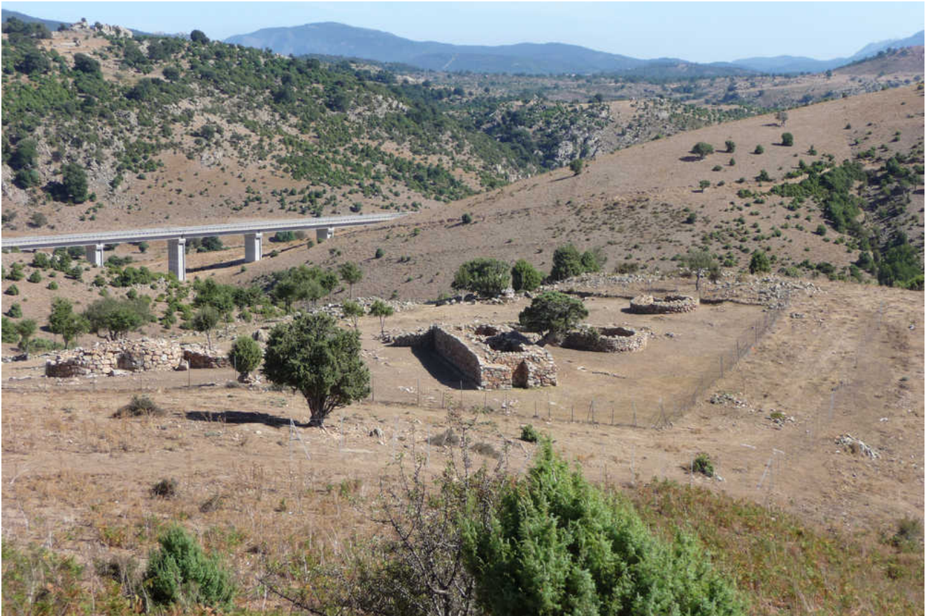
Fig. 3 - Panoramica del sito (da http://www.beniculturali.it/mibac/export/MiBAC/sito-MiBAC/Menu Utility/Immagine/index.html_647931255.html ).

Gli interventi di scavo del primo tempio a megaron , realizzati durante gli Anni Ottanta e Novanta del secolo scorso, alcuni dei quali finalizzati a contrastare nuovamente il saccheggio di ignoti scavatori clandestini, hanno posto l'accento sull'importanza del sito e, oltre ad evidenziare tipologia, estensione e consistenza dell'impianto templare, nonché le differenti fasi di utilizzo e i presumibili rapporti con l'agglomerato attiguo, hanno comprovato, sulla base soprattutto del contesto materiale, che esso era stato edificato su un insediamento abitativo precedente. Negli anni 2007-2011 ulteriori campagne di scavo hanno consentito di riportare alla luce altri due inediti edifici templari, di cui il megaron 2, all'interno del vano di fondo absidato un particolare altare costruito con blocchi quadrati di rocce vulcaniche con il prospetto decorato da due protomi di ariete in alto rilievo, sormontato da un focolare rituale composto da vari blocchi basaltici ad imitazione del coronamento di una torre nuragica.