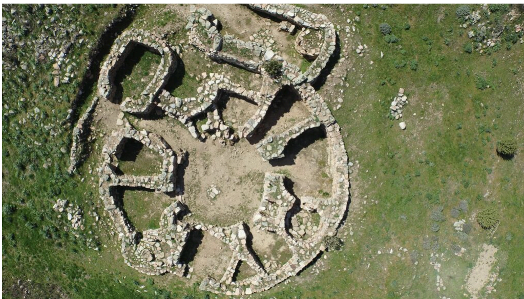
Fig. 9 - Panoramica dell' insula 1.

Un' insula abitativa, edificata in prossimità del megaron 3, su un terreno piuttosto scosceso, contenuta da un muro esterno, era composta da 12 vani con ingressi originariamente aperti su un cortile centrale circolare coperto da un battuto pavimentale in argilla. Nel corso del suo utilizzo è stata sottoposta a continui adattamenti e modifiche ancora oggi visibili nella tessitura muraria dei vari ambienti (fig. 9).