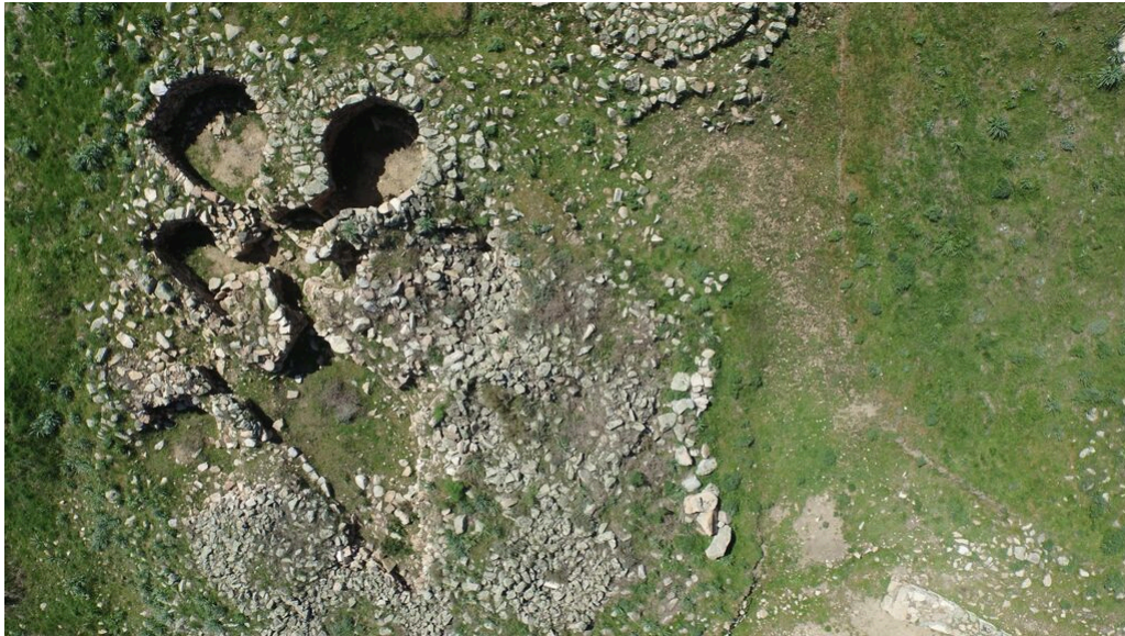
Fig. 10 - Panoramica dell' insula 2.

Tra i materiali rinvenuti nei vani e nei ripostigli si segnalano i numerosi oggetti in bronzo, in ferro, recipienti ceramici tra cui di particolare interesse un'anfora ansata di tipo cananeo con una iscrizione incisa sulla spalla in caratteri fenici filistei databile fra IX e VIII a.C.