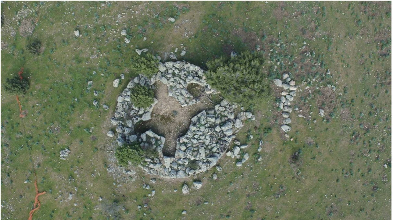
Fig. 2 - Foto area del nuraghe Arcu'e Sforru

Nel corso del tempo il sito fu interessato più volte da distruttivi scassi clandestini. Di conseguenza, anche allo scopo di fermare il saccheggio dell'estesa area archeologica, a partire dagli Anni Ottanta del secolo scorso, la Soprintendenza Archeologia della Sardegna sotto la Direzione Scientifica della Dott.ssa Maria Ausilia Fadda avviò una serie di interventi di scavo, i cui risultati hanno contribuito alla conoscenza alla conoscenza degli aspetti di tipo prettamente topografico e planimetrico e al ritrovamento di reperti di notevole valore scientifico, capaci di fotografare uno spaccato della vita quotidiana, delle attività produttive e della religiosità della comunità nuragica insediatasi nella zona.