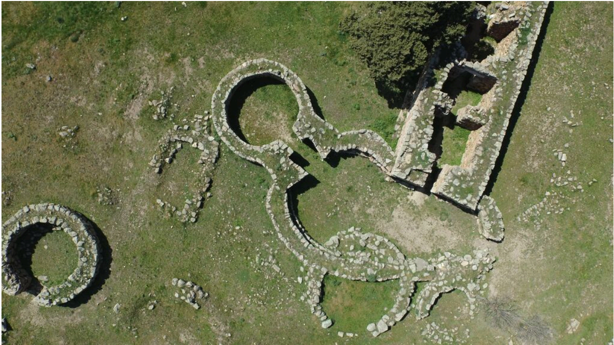
Fig. 5 - Temenos che racchiude il tempio a megaron 1.

In prossimità del tempio a megaron 1 si conservano i resti di due forni vicini di forma circolare, usati per la fusione dei minerali di rame, piombo e ferro, e di una capanna circolare (fig. 6).