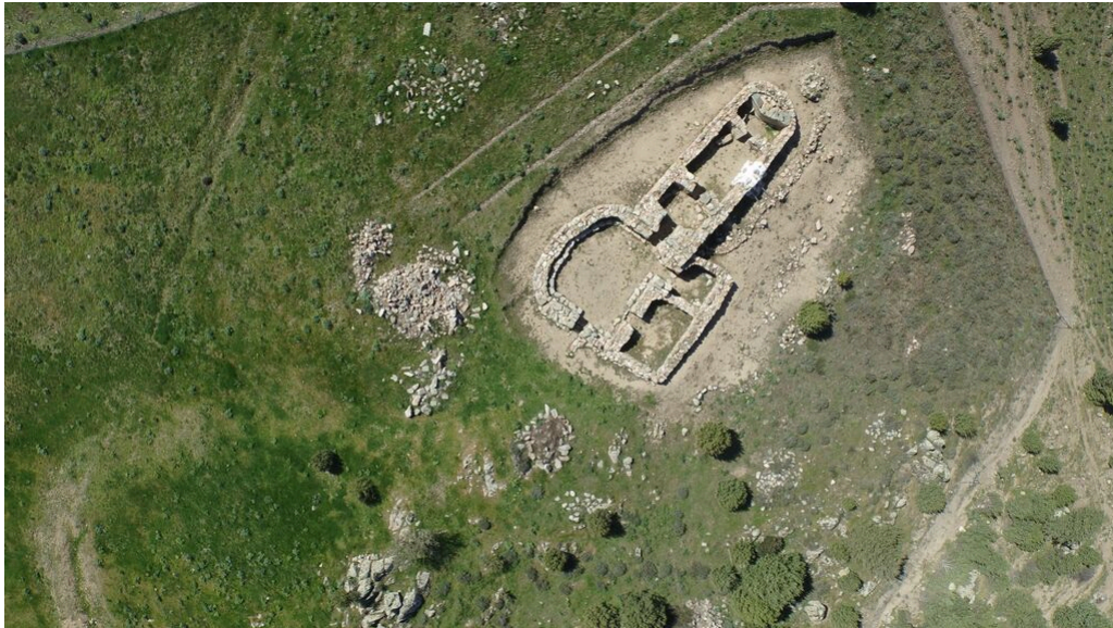
Fig. 7 - Panoramica del tempio a megaron 2.

Negli anni 2007-2011 ulteriori campagne di scavo hanno consentito di riportare alla luce altri due inediti edifici templari, di cui uno in particolare, il tempio a megaron 2, è di tipologia inedita. Il tempio è costruito in granito e scisto locali, presenta una pianta rettangolare absidata lungo 14,5 metri, suddivisa in tre ambienti originariamente coperti con tetto formato da pali lignei e frasche (fig. 7).