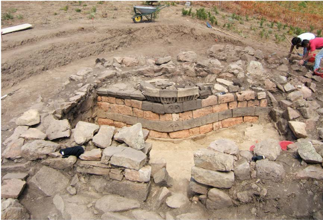
Fig. 8 - Il vano absidato in cui è stato rinvenuto l'altare-focolare in corso di scavo (da CONGIU 2013, fig. 5 p. 1475).

Anche questo tempio è racchiuso all'interno di un ampio temenos di forma irregolare con panchina, su cui si affacciano altri due ambienti rettangolari: in questo spazio dovevano svolgersi rituali legati al culto, come testimoniano i numerosi reperti che attestano una frequentazione compresa tra il Bronzo Finale e la I Età del Ferro.