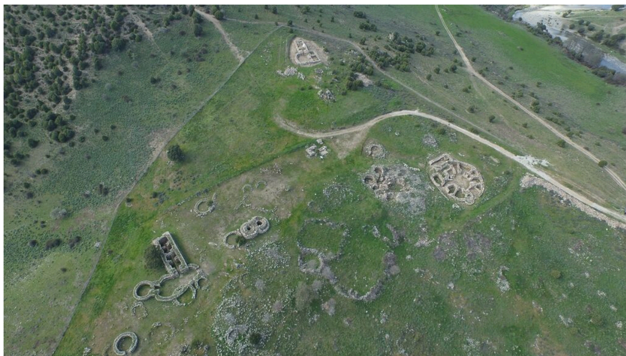
Fig. 1 - Foto area del sito di S'Arcu'e Is Forros

Il complesso culturale nuragico di S'Arcu'e Is Forros è ubicato su un colle al confine tra la Barbagia e l'Ogliastra, in agro di Villagrande Strisaili, nella vallata del Riu Pira'e Onni a Sud del passo di Correboi, indicata in cartografia con il toponimo sardo di significativo richiamo antico Interrabbas , naturalmente circoscritto da due corsi d'acqua a regime torrentizio affluenti del rio Flumendosa, crocevia della transumanza dalla costa verso le zone montane dell'entroterra. Nel sito si concentra un contesto archeologico (XV-VI secolo a.C.) che racchiude al suo interno un villaggio santuario con edifici templari del tipo a mega-ron , costruito su un precedente insediamento nuragico (fig. 1).