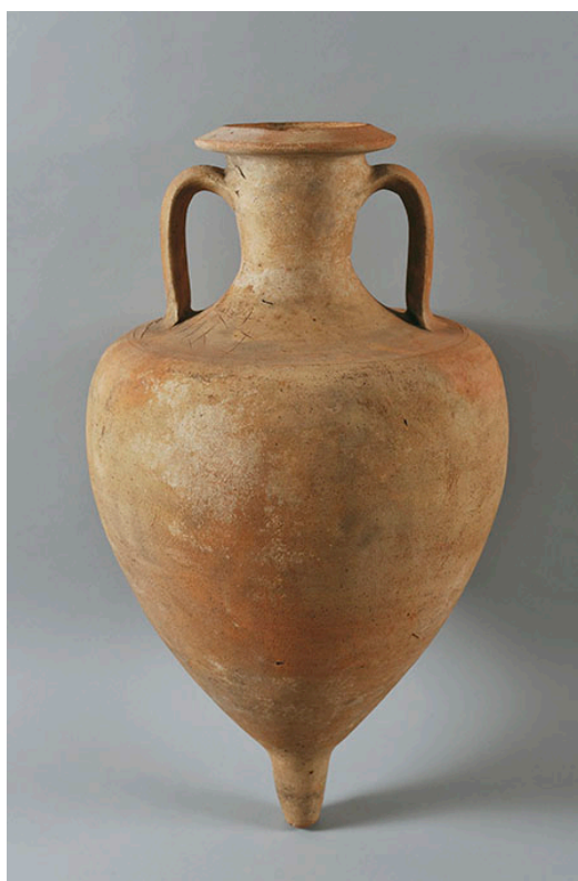
Fig. 3 - Anfora greco-italica

(da http://mostre.museogalileo.it/vinum/oggetto/AnforaVinariaTipoGrecoitalicoTransizionale.html ).