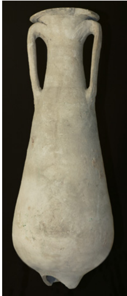
Fig. 4 - Anfora Beltrand II B dalla necropoli di Puerta de Tierra – Cadice, conservata nel Museo di Cadice.