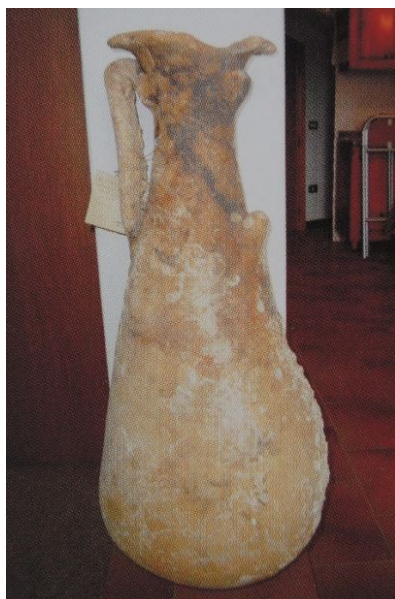
Fig. 1 - Anfora Beltrand II B recuperata nel mare di Arbatax (da SALVI ET ALII 2005, p. 81).

Presenta un corpo piriforme allungato, notevolmente espanso verso la base; collo ristretto senza raccordo con la spalla e orlo estroflesso con imboccatura larga; anse a nastro; puntale alto (figg. 2-3). Questo tipo di contenitore veniva prodotto nella Betica 2 . L'altezza media, negli esemplari integri è di circa 100-110 cm (fig. 4). Il tipo venne prodotto dagli inizi del I secolo d.C. alla metà del II ed è diffuso in tutto il bacino del Mediterraneo. Veniva utilizzato per trasportare salse di pesce ( muria ).